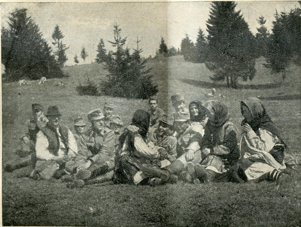
ВЕЛИКДЕНЬ У. С. С. У ГОЛОВЕЦЬКУ 1915 Р.