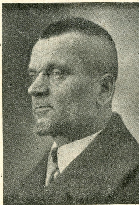
Проф. Іван Боберський на еміграції в Канаді.

Дідилів дав 184 к. і 3 мішки білизни, робітники фабрики тютюну в Винниках зложили 174 к., Усте єпископське надіслало 200 к. Збірки надсилали поштовці, судовики.