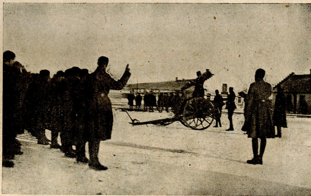
Присяга новобранців-гарматчиків запасної батерії в Коломиї. Грудень 1918 р.

Організаційні хиби були незалежні від пор. Р.