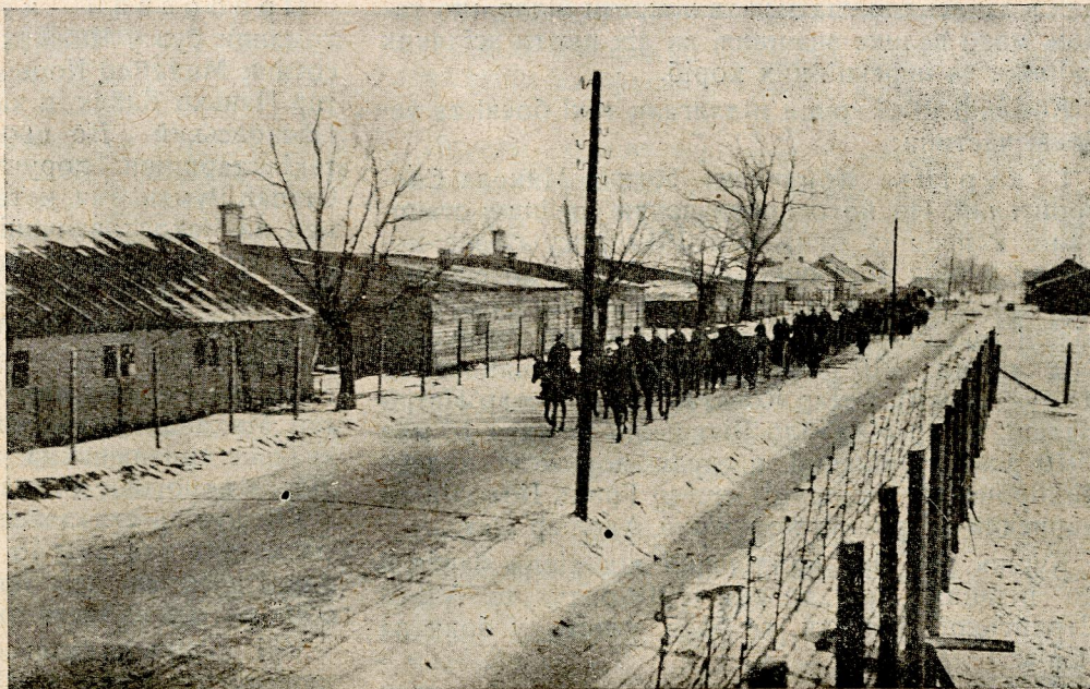
В дорозі на двірць запасна батарея Коломия. Грудень 1918 р.

До команди групи приходили щодня часописи в більшій кількості, які розділювано поміж куріні та підвідділи. Постійно приходили „Стрільця“ з Ходорова, „Наддністрянські Вісти“ з Самбора та „Покутський Вістник“ з Коломиї. Дуже почитною була стаття друквана в „Наддністрянських Вістях“ „Іван Причепка“. Автор статті в популярний балачковий спосіб пояснював причини українсько-польської війни, висміюючи тих, які