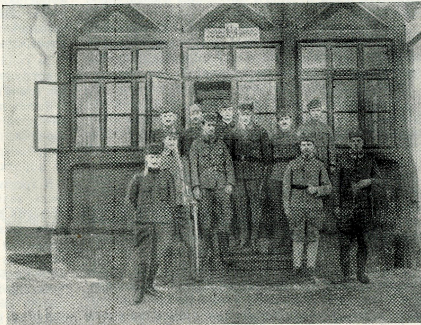
Військова повітова команда в Косові 1918 р.

без перешкод пройшов повз міст на Ікві і тихенько ввійшов на станцію. Тут ще не було червоних. Від наших розвідчиків довідався, що червоний панцирний потяг вже стоїть у Дубні