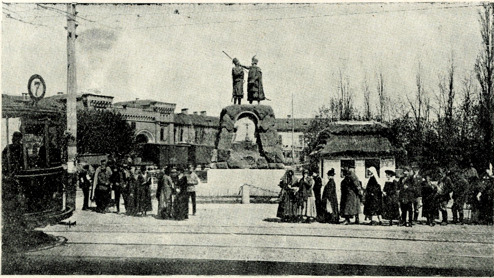
Вид на арсенал у Київї на Печерську від пам'ятника Іскри та Кочубея.

рятувала положення в боях. Вона між іншим брала Чорний Острів від червоних у 1919 р.