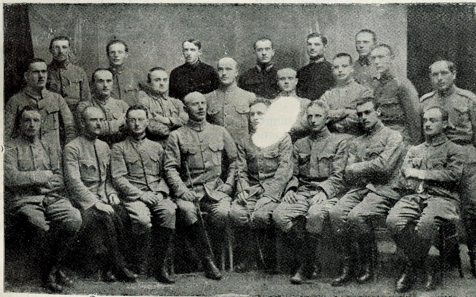
Старшини 2. п. п. в 1919 р. після переходу на Чехословаччину.