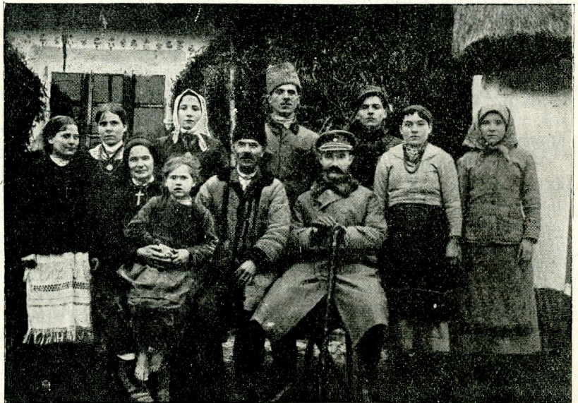
Генерал-хорунжий Ткачук серед селян в селі Кийданцях коло Тернополя 1920 р.

Балакучість „товариша“ зникла. Йшов задумавшись, час від часу запитуючи, чи ще далеко.