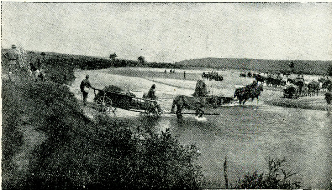
Обоз переходить ріку вбрід

В тойже самий день одержав я з команди II-го корпусу наказ відіхати з кавалерійською стежою до Гайсина. Апарат Юза і телефонічна стежа залишилися в Нижній Кропивні; тут же осталось двох кавалеристів. Змисл цього перегруповання був такий: наша делегація, що переговорювала з командою денікінської армії (я знав, що переговори ведуться десь в поблизу Гайсина, але де саме, про це поінформований не був) мала на випадок потреби передавати свої звіти чи запити