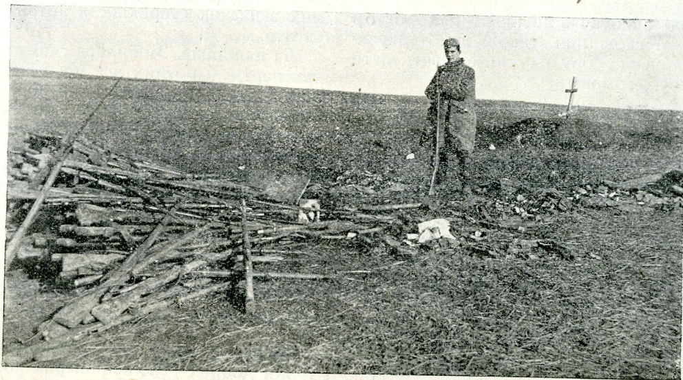
НА ПОБОЄВИЦІ ПІД ПОТУТОРАМИ