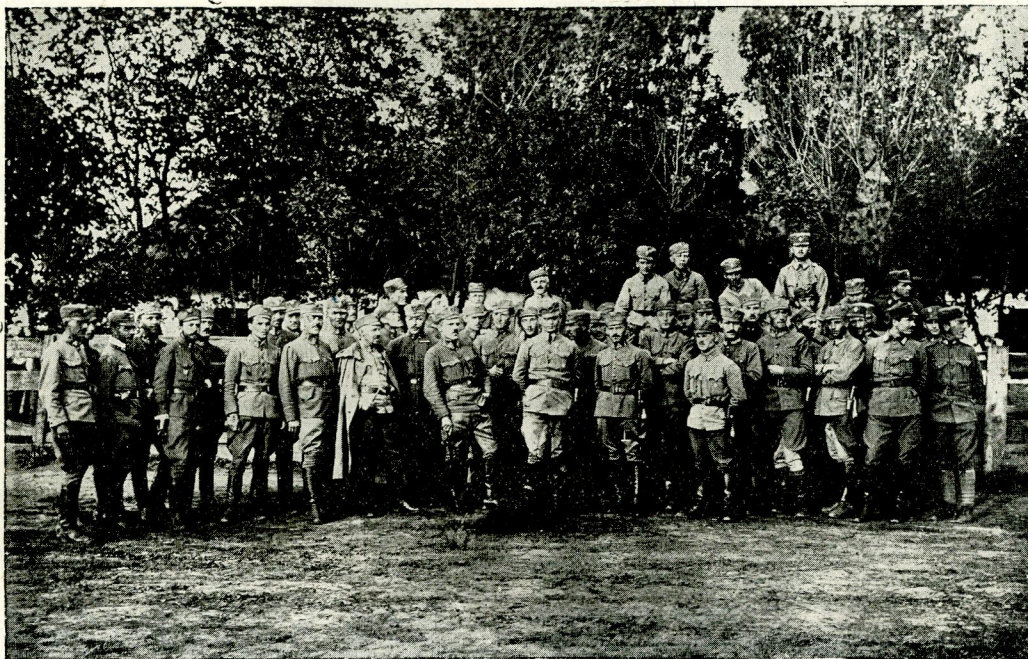
Старшини і підстаршини У. С. С. у Грузькій біля Єлисавету 1918 р.

Однак Начальна Команда не скінчила на жаданню доповнень від запілля. Щоби мати відповідні сили до наступу на залізничний шлях Львів—Перемисьль, зажадав полк. Курманович, щоби кожна бригада поставила до диспозиції Началь-