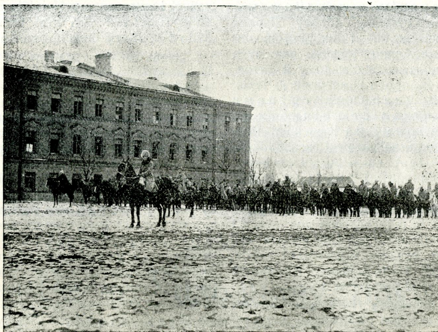
Кіннота VI. Бригади У. Г. А. Винниця 21. XI. 1919 р.

сані й тільки дуже мало відомостей можна звідтам засягнути. Інші вищі команданти, передусім ті, що були безпосередно причасні до цієї акції, як прим. ген. Курманович, ген. Кравс, чи полк. Гриць Коссак — ще в цій справі, здається, не виповілися. Отже так маємо до диспозиції тільки згадані спомини ген. Павленка, а крім того й „Спомини“ д-ра Степана Шухевича, які дещо кидають світла на цю важну подію недавно минулого.