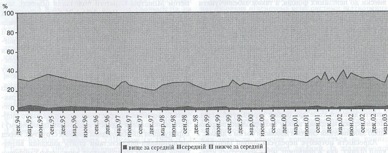
Рис. 2. Структура населення за оцінкою свого матеріального становища відносно середнього в країні рівня, 1994-2003 рр.

нутих демократичних суспільствах Європи; однак у нас представники цієї групи близько половини своїх грошових доходів отримують нелегально, через що їхня економічна діяльність суперечить принципам соціально орієнтованої ринкової економіки;