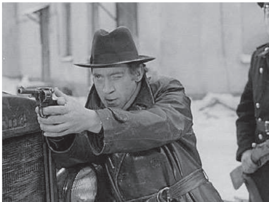
Володимир Висоцький в ролі Гліба Жеглова

Серед відомих кінокартин виробництва Одеської кіностудії, що стали наслідком плідної праці багатьох інтернаціональних творчих колективів є «Весна на Зарічній вулиці», «Білий пудель», «Вірність», «Два Федори», «Вертикаль», «У пошуках капітана Гранта», «Міський романс», «Довгі проводи», «Капітан Немо», «Червоні дипкур'єри», «Багряні береги», «Серед сірих каменів», «Військово-польовий роман», «Данило, князь Галицький», «Д'Артаньян