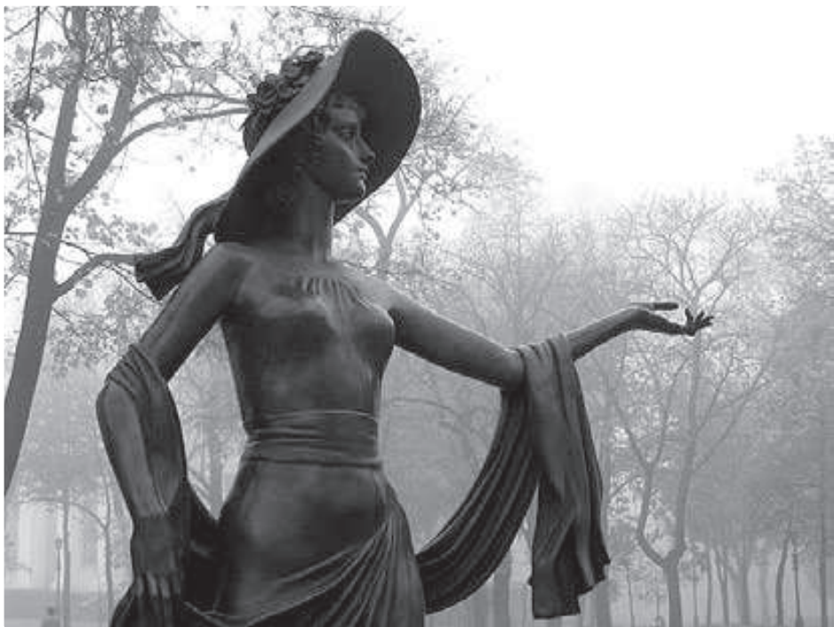
Пам'ятник В. Холодній в м. Одесі

значилася «Кіносекцією політвідділу 41-ої дивізії Червоної армії» . Перший знятий тут художній фільм «Павуки й мухи» , що складався з двох частин, закликав не піддаватися ворожій пропаганді. 1922 р. «кіносекцію» реорганізували в Одеську кінофабрику Всеукраїнського фотокіноуправління (ВУФКУ) , 1929 р. – в Одеську кінофабрику «Українфільм» , у ведення якої перейшла Ялтинська фабрика і три Одеські фабрики. Кадри для кіно в Одесі готувала