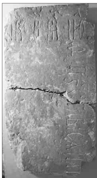
2. Надмогильна плита з іменем Остафія Дашковича. Сторона Б