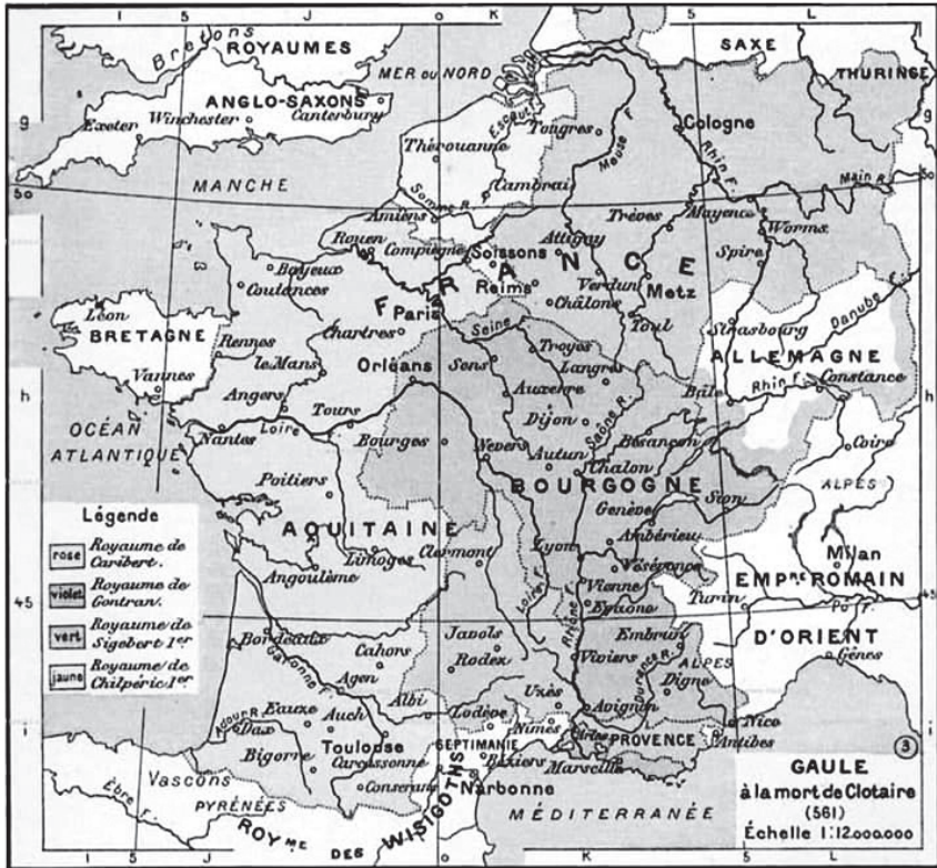
Рис. 2. Королівство франків станом на час смерті Хлотаря I (561 р.)