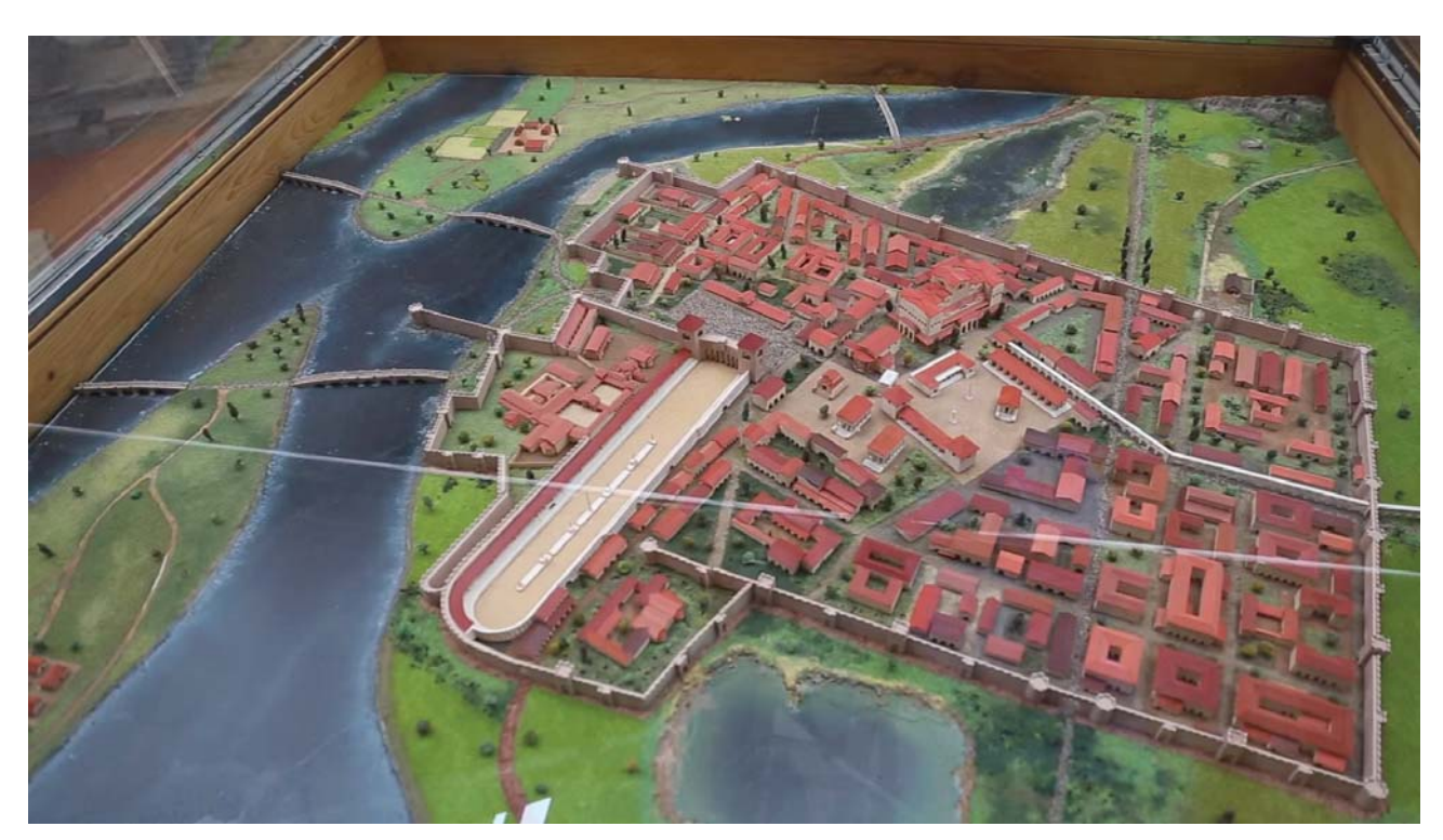
Іл. 3. Діорама пізньоримського міста Сирмій, розташована у Археологічному музеї Імператорського палацу у Сремській Митровиці, Республіка Сербія. Композиція відтворює панораму міста протягом IV ст. — 582 р.

Перебіг війни з аварами вплинув на кар'єрне зростання офіцера. Кочовики, зайнявши території Паннонії та Мезії, взяли в облогу місто Сирмій (іл. 3). Спроби аварського кагана Баяна І взяти населений пункт штурмом, а пізніше — схилити гарнізон до капітуляції, були провальними (Menander 1985, р. 224—226). Збройне протистояння зайшло у глухий кут та потягло поновлення переговорів між кочовиками та Константинополем з другої половини 568 р. До стану