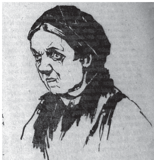
Рис. 8. (Коммунарка Украины. — 1924. — № 3)