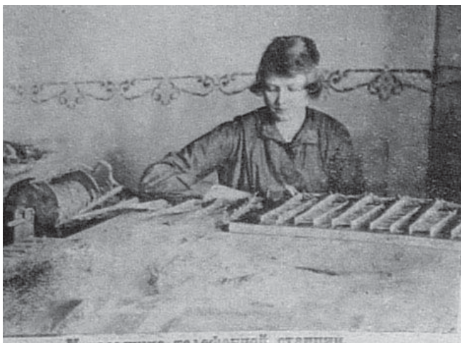
Рис. 3. (Коммунарка Украины. — 1924. — № 8)