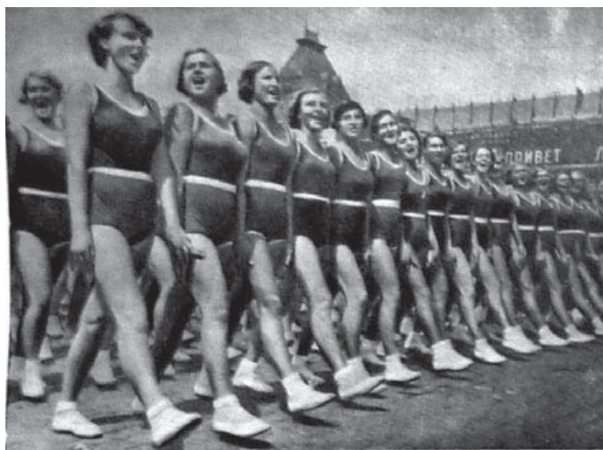
Рис. 7. (Общественница. — 1936. — № 1)