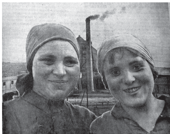
Рис. 6. (Коммунарка Украины. — 1934. — № 1)