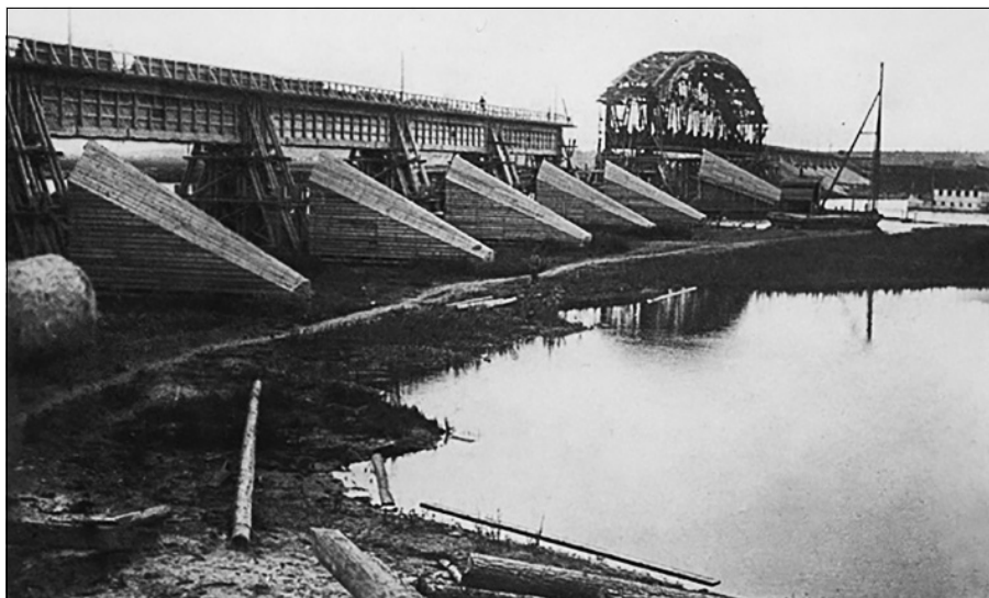
Залізничний міст через Десну біля села Пирогівки, 1916 р.