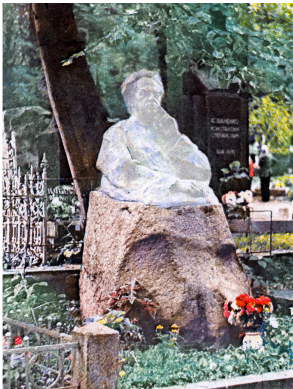
Могилы поэта М.Ф.Рыльского. Байково кладбище, главная аллея