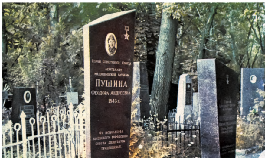
Могила Героя Советского Союза Ф.А.Пушиной. Святошинское кладбище