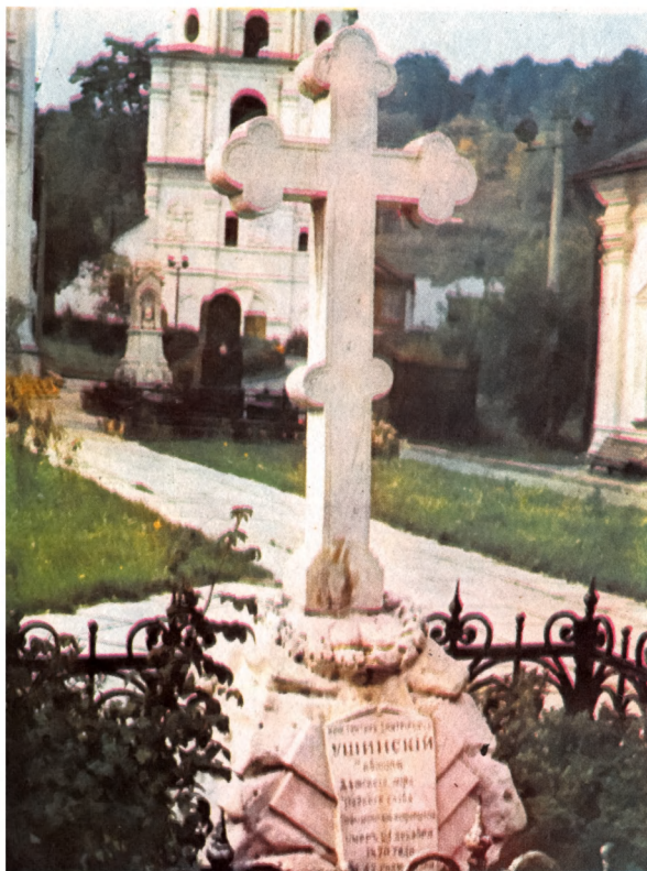
Могила педагога К.Д.Ушинского. Некрополь Выдубецкого монастыря