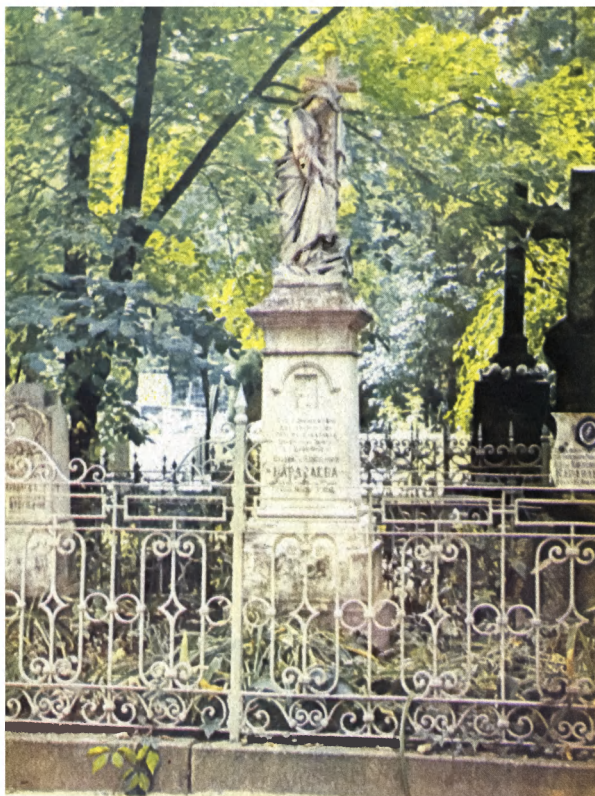
Надгробие хирурга В.А.Караваява. Байково кладбище