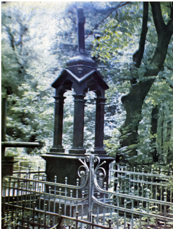
Надгробие художника В.Д.Орловского. “Пустая сень” Лукьяновское кладбище