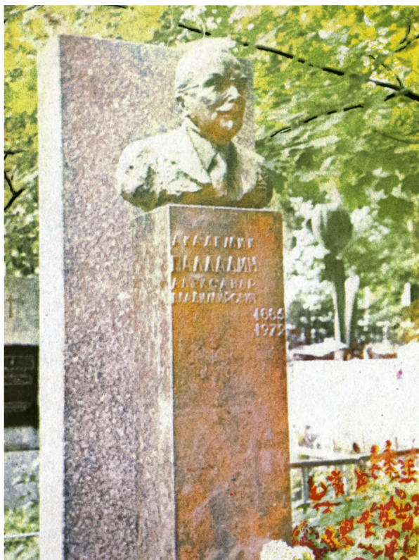
Надгробие академика А.В.Палладина. Байково кладбище