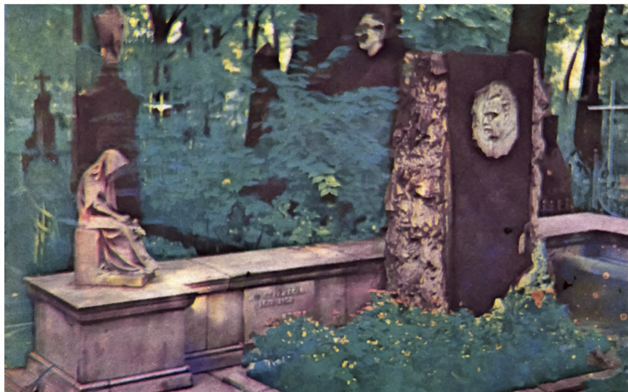
Надгробие академика Н.Д.Стражеско. Слева — скульптура, перемещенная с памятника В.Д.Орловскому