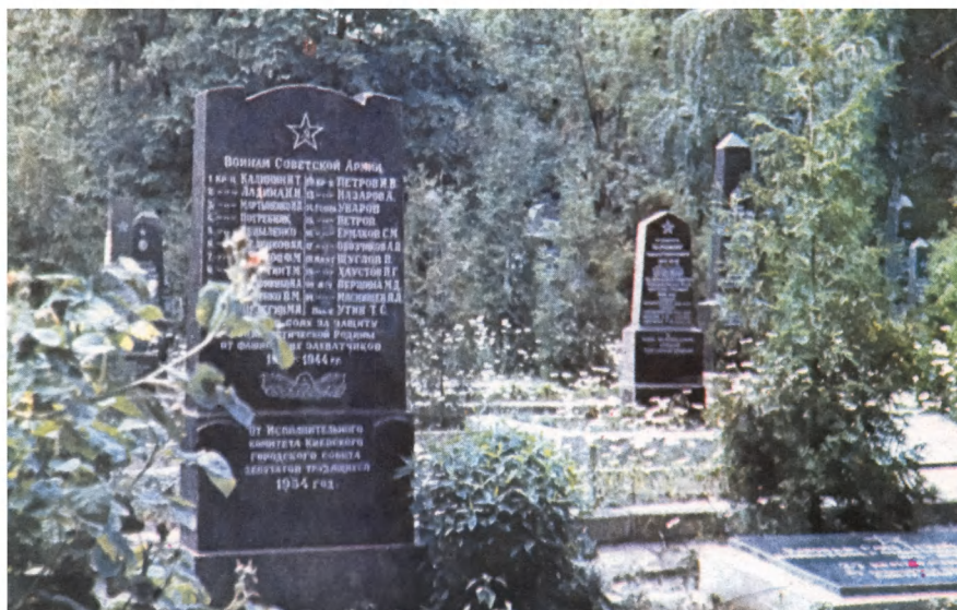
Захоронение военнослужащих, погибших во время Великой Отечественной войны 1941—1945 гг. Святошинское кладбище