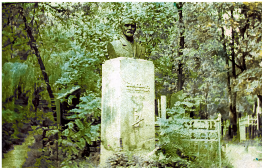
Надгробие художника И.С.Ижакевича. Байково кладбище