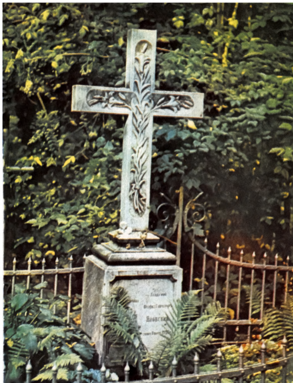
Надгробие академика Ф.Г.Яновского. Лукьяновское кладбище