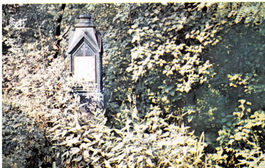
“Безымянный” памятник над братской могилой жертв воздушного налета в ночь на 11 мая 1943 года. Лукьяновское кладбище