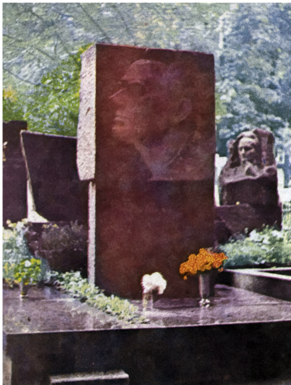
Надгробие поэта П.Г.Тычины. Байково кладбище