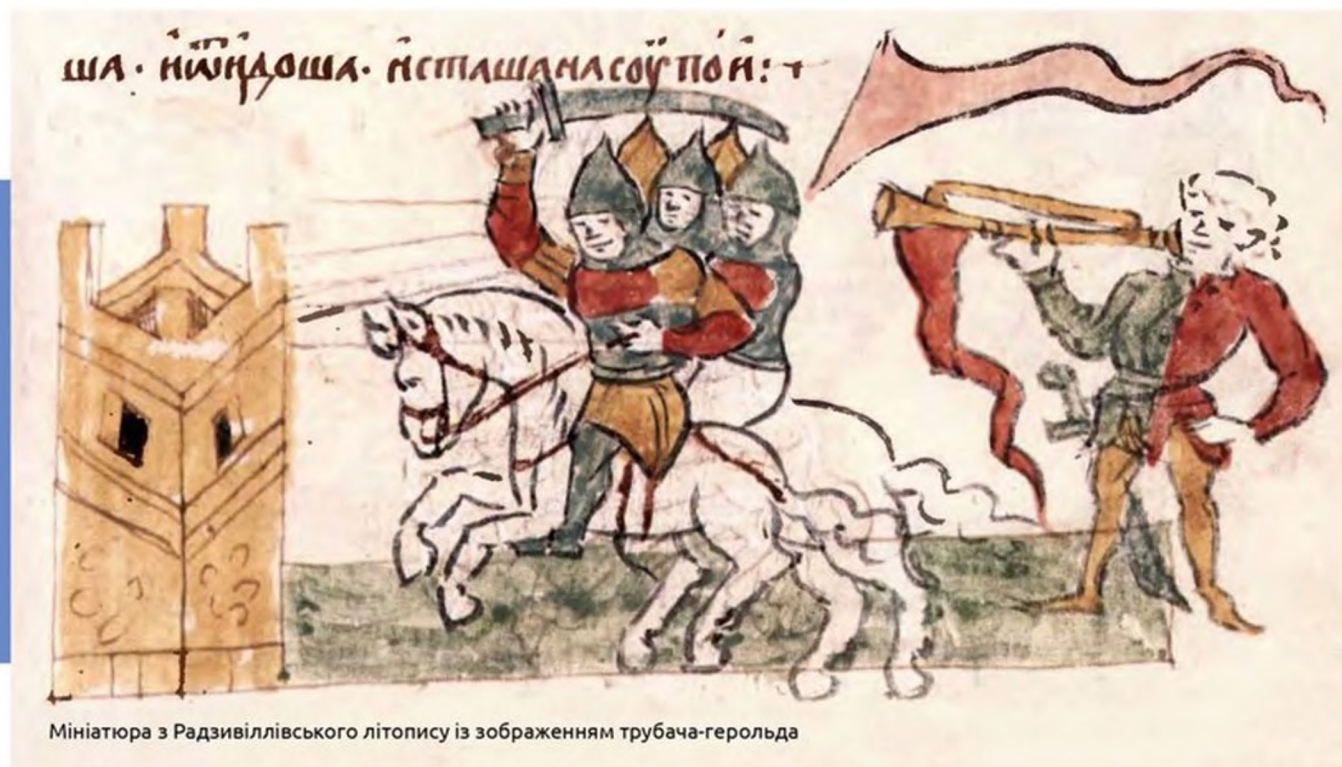
Мініатюра з Радзивілівського літопису із зображенням трубача-герольда

При дворі правителя сусіднього Угорського королівства Сигізмунда Люксембурґа (1368–1437) також були музиканти. Про це свідчить