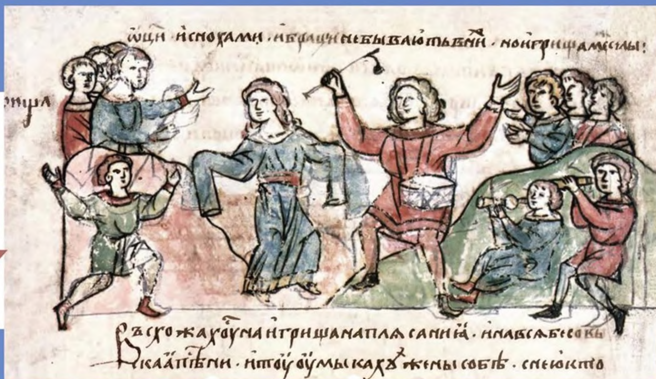
Мініатюра «Игрища» з Радзивілівського літопису

МУЗИЧНА КУЛЬТУРА НАШИХ ПРАЩУРІВ ВІДІГРАВАЛА ВАЖЛИВУ РОЛЬ У ПОЛЬСЬКІЙ КОРОНІ. САМЕ РУСИНИ ПЕРЕВАЖАЛИ ПРИ ДВОРІ ВЛАДИСЛАВА II ЯГАЙЛА. ВИХОВАНИЙ У ВЕЛИКОМУ КНЯЗІВСТВІ ЛИТОВСЬКОМУ, КОРОЛЬ ЗРОСТАВ В ОТОЧЕННІ РУСЬКОЇ КУЛЬТУРИ. РУСИНАМИ БУЛИ НЕ ЛИШЕ МУЗИКАНТИ, А Й СОКІЛЬНИЧІ, МИСЛИВЦІ, КУПЦІ, ПЕКАРІ ТОЩО. ВІРОГІДНО ЇХНЯ КУЛЬТУРА МАЛО ВІДРІЗНЯЛАСЯ ВІД КУЛЬТУРИ СУСІДІВ НА ЗАХОДІ, ЯК-ОТ У ТЕВТОНСЬКІЙ ДЕРЖАВІ ЧИ УГОРСЬКОМУ КОРОЛІВСТВІ. НАЙДАВНІША ЗБЕРЕЖЕНА НОТНА ПІСНЯ ПОЛЬСЬКОГО КОРОЛІВСТВА МОГЛА БУТИ ЗАПИСАНА ПІДО ВПЛИВОМ РУСЬКИХ МУЗИКАНТІВ