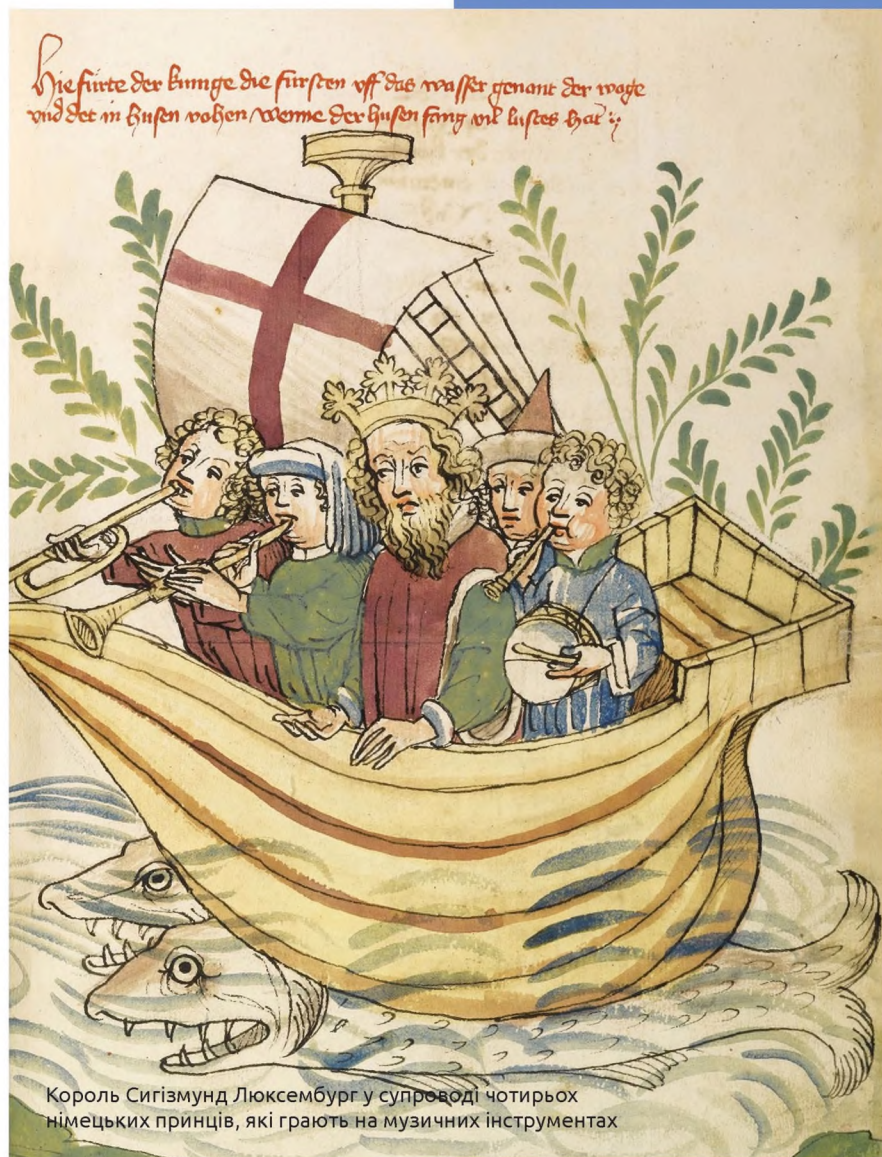
Король Сигізмунд Люксембург у супроводі чотирьох німецьких принців, які грають на музичних інструментах

Який вони мали вигляд, можна уявити за допомогою Радзивілівського літопису, створеного у 1490-х на Волині. На п'яти мініатюрах зображено трубачів-герольдів у типовому німецькому одязі того часу. Це не дивно, якщо ми згадаємо, що музиканти Гедиміновичів неодноразово подорожували вглиб земель Тевтонського ордену. Вони грали на металевих двічі зігнутих трубах. В окремих випадках на