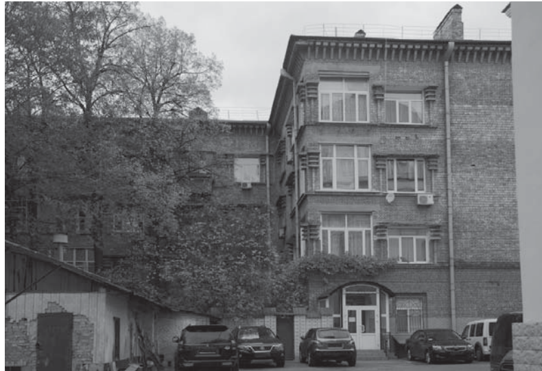
Рисунок 3. Багатоквартирний житловий будинок (ОСББ “Науковець”). Побудований 1937 р. Фото І. Зосько, 2016 р.

міум Груп” 18 , Центральна Багетна майстерня 19 , Дизайнерський тату-салон TST 20 , офіс компанії Pack&Go 21 , Інтернет-магазин “Все для ноутбуків” 22 та ТОВ “Арбуз”, що надає послуги з організації свят та урочистостей 23 .