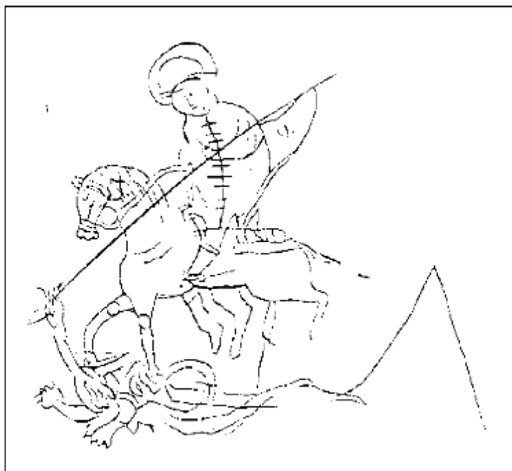
Фрагмент перелицьованого надгробка з Фуни. Графіті з зображенням св. Георгія (За В. П. Кирилком).

Окрім різного роду списів та дротиків, на озброєнні кафинського ополчення принаймні в останні роки існування генуезької Кафи (50-70-ті рр. XV ст.) були і алебарди. Цей вид зброї являє собою лезо сокири, увінчане колючим вістрям і з гострим шипом (гаком) з протилежного боку. Такий наконечник закріплювався на держаку завдовжки від 1,8 до 2,4 м за допомогою цвяхів, як правило, вбитих крізь довгі обкладки – лангети. Лангети розташовувалися вздовж древка від його вершини до основи. Цвяхи могли забиватися з одного боку, пробиваючи держак наскрізь до отвору в протилежні лангети, де вони розклепуються, в іншому випадку