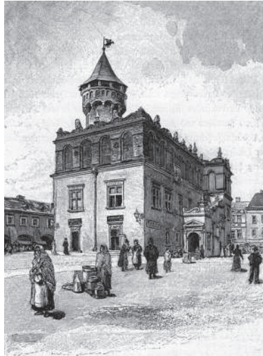
Рис. 6. Ратуша у Тарнові. Арх. Джовано Марія Падовано, 1588 р.

Замки другої половини XVI ст. стають скоріше палацами й будуються серед таких самих палаців міських власників. Прикладом є палац в Бетлановце, збудований у 1564–1568 рр., який має за основу дім городянина, схожий на зразки забудови ринкових площ згаданих ренесансних