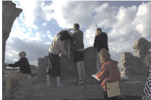
Рис. 11. Студенти Харківського національного університету будівництва і архітектури виконують обміри аттика палацу Сенявських - Чарторийських в Меджибожі. Фото 2017 р.

від основи. Ваза 4 має декор на висоті 480 мм від основи у вигляді скошених полицок з тесаної цегли. Завершення декоративних ваз також різне, а саме: ваза 3 – кругла у перетині у вигляді перевернутого усіченого конуса, ваза 2 має завершення, в перерізі якого лежить чотирилисник, ваза 4 має в перерізі голови 6 ребер, і ваза 1 – 8 ребер. Дивлячись на загальний профіль всіх ваз, можна говорити про те, що за зовнішнім виглядом вони схожі на кубки, чаші, пінаклі за часів романтизму. Вони є окрасою палацу й встановлені, ймовірно, під час пізнього періоду будівництва.