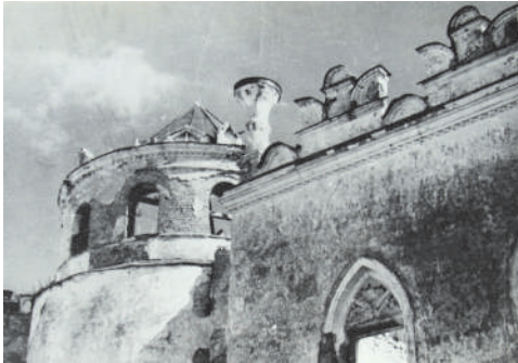
Рис. 9. Фрагмент фасаду з вазою 2 (нині втраченою). Фото 1950 р.

мм (вази 2 і 3), 600 \times 600 мм (ваза 1) й 700 \times 700 мм (ваза 4). Загальна висота ваз варіюється від 2 650 мм (ваза 2 і 3) до 2 860 мм (ваза 1 і 4). Відмінності в розмірах ваз, розташованих на північно-східному фасаді (вази 1 і 4) і ваз на південно-західному фасаді (вази 2 і 3), може свідчити або про різний час спорудження, або про більш пізнє відновлення ваз із зміною їхнього декору. Вази 2 і 3 на південно-західному фасаді будівлі мають спільну висоту, сільний розмір стовбуру вази – 200 мм, тільки стовбур вази 1 у перерізі має коло, а ваза 3 – квадрат. Розширення стовбуру починається на одній висоті – 1 470 мм (ваза 2) й 1 520 мм (ваза 3), також ідентична й спільна висота голови вази, що дорівнює 780 мм. Вази північно-східного фасаду, номер 1 і 4, теж подібні за своїми розмірами – їхня висота 2 810 мм (ваза 1) й 2 860 мм (ваза 4). У перетині стовбуру лежить коло діаметром 250 мм, розширення стовбуру починається на висоті 1 420 мм від основи, і висота голови вази становить 1 440 мм (ваза 4) і 1 490 мм (ваза 1). Невеликі розбіжності у розмірах – це похибки обмірів чи результат ремонту та минулого оновлення ( рис. 10 ).