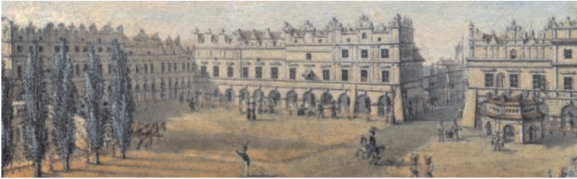
Рис. 3. Jan Pawel Lelewel (1796–1847). Замость. Вид на Ринок зі східної сторони, 1823-1826 рр. Арх. Бернардо Морандо (1540–1600)

Поділля» [3]. Однак можна вважати, що будівельна мода на оздоблення фасадів в стилі «польського ренесансу» є особливістю політичного впливу Корони Польської, поширеної на приєднані в 1413 р. міста Спішу у зв'язку із заставою за великий грошовий кредит. Тільки у 1772 р. ці землі було повернено Угорщині внаслідок поділу території Польщі. Під цю угоду потрапили землі коло Спішу – Нова Вес Кошицького краю (словацьк. – Okres Spišská Nová Ves ). Тобто, на час будівництва палацу Турзо-Фейгеля [4, с. 586], який є дуже подібним до палацу Сенявських у Меджибожі, землі нібито Словаччини знаходились під Коронаю Польською.