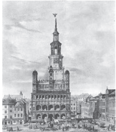
Рис. 4. Juliusz Freter. Стара Ринкова площа та Ратуша зі сходу, 1845–1855 рр. Арх. Джованні Батиста Квадро, 1550 р.

Вперше при перебудові Ратуші в Познані в 1550 р. архітектор Джованні Батиста Квадро (пом. 1590 р.) прибудував до готичної споруди аттик з кутувими башточками (рис. 4). Однак як оздоблення у вигляді «корони» у польському ренесансі, аттик вперше з'явився на даху суконних торговельних рядів на ринковій площі у Кракові – Сукенніце (польск. – Sukiennice ) за авторством скульптора Джовано Марії Падовано (1493–1574) в 1556–1560 рр. (рис. 5) й у цей же час ним виконується оздоблення даху Ратуші Яна Тарновського (1488–1561) у Тарнові в 1558 р. Обидві споруди мають подібний аттик у вигляді сувоїв волют, які разом складають корону (рис. 6). Ратуші в Сандомірі й Хелмно також отримали багаті аттики (рис. 7). Атик Ратуші у Хелмно надбудований у 1567–1572 рр. у високому вигляді, приховуючи горище.