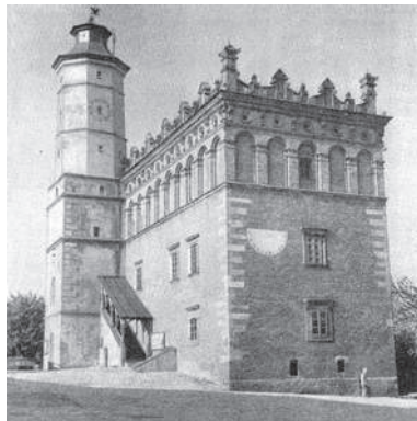
Рис. 7. Ратуша у Сандомірі. Арх. Джовано Марія Падовано