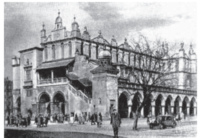
Рис. 5. Торговельні ряди на Ринковій площі у Кракові (Сукенніце), 1556–1560 рр. Арх. Джовано Марія Падовано (1493–1574)