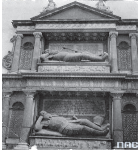
Рис. 1. Надгробок Миколая Сенявського (зверху) та його сина Ієроніма у сімейній каплиці в Бережанах.

релігійний полеміст епохи Відродження Миколай Рей (1505–1569), був другом Миколая Сенявського (рис. 1), а на спомин його сина Ієроніма Сенявського присвятив йому твір «Зброя певна кожного рицаря християнського» у збірці « Żywot człowieka poczciwego », надрукованої в Кракові в 1567 р.