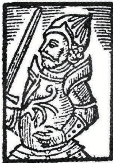
Рис. 3. Портрети з гербовника В. Папроцького (1578): «Димитр Вишневецький, котрий у Туреччині страчений, муж вічної пам'яті гідний» та «Міхал Вишневецький, староста Черкаський, муж благородний»