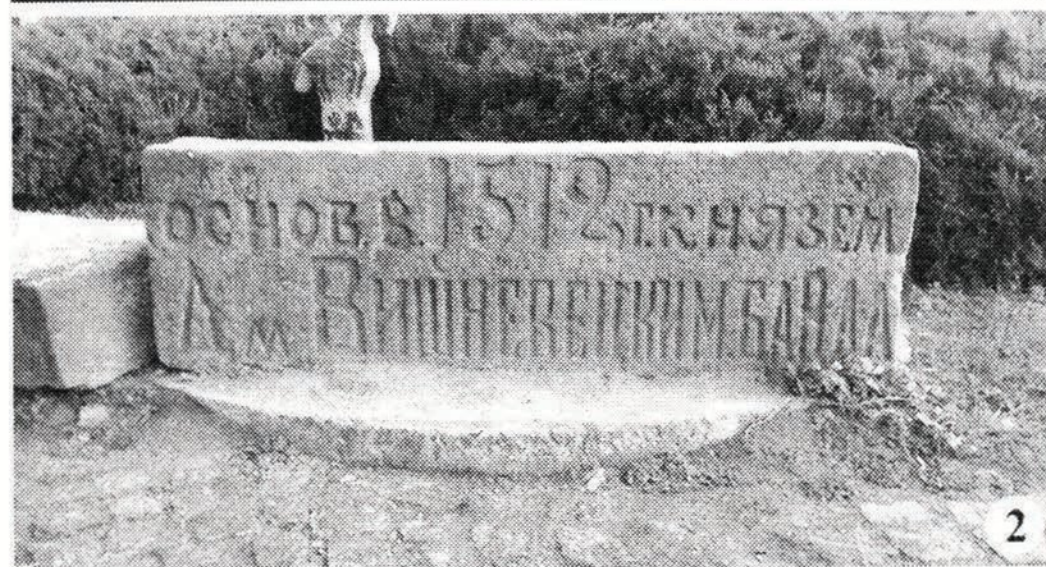
Рис. 4. Приклади міфотворчості, пов'язані з Дмитром Вишневецьким.