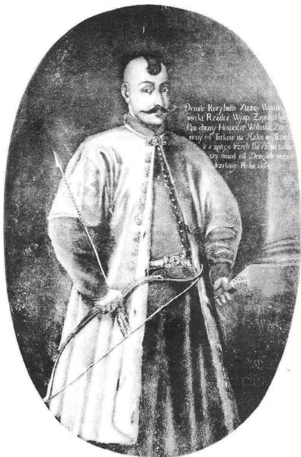
Рис. 2. Уявний портрет князя Дмитра Івановича Вишневецького з колишньої галереї Вишневецького палацу, XVIII ст. (нині перебуває в Національному музеї історії України)