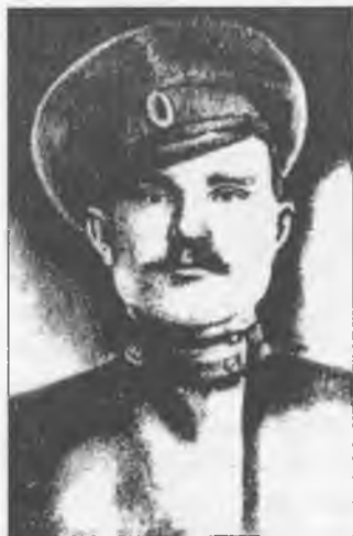
Карпо Іванович Махно

Про загибель найстаршого брата Карпа у районній газеті "Голос Гуляйпілля" (4 листопада 1998 року) розповів двоюрідний онук Н. І. Махна Віктор Іванович Яланський у статті "Старший брат Нестора", присвячений 110-й річниці від дня народження Н. І. Махна: