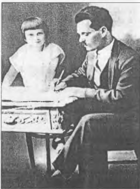
Н. І. Махно з дочкою Оленкою в Парижі

Свій строк "мати" Галина відбувала в Дубровтабі, тут перебувала і відома радянська естрадна артистка Людмила Русланова, яка відбувала там свій тюремний строк. Вона частенько, на нашвидкуруч збитих підмостках із круглого лісу, виконувала свої знамениті "...Әх, валенки, валенки, да не подшиты, стареньки", розважала нещасних засуджених громадян під час сталінського свавілля. Там же відбувала свій строк і дружина Всеросійського старости Михайла Івановича Калініна, яку засуджені, знаючи, хто