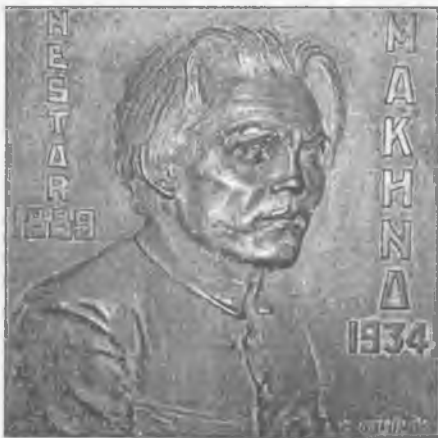
На паризькому кладовищі Пер-Ля-Шез

Так закінчив у чужому Парижі земний шлях селянський син із степового українського