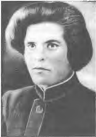
Нестор Іванович Махно. 1920 р.

"Відмова Махна йти під польські кулі і шаблі тоді, коли його і армію косив тиф на початку зими 1920-го, розлютила вище військове командування РРФСР, — писав запорізький журналіст І. Я. Науменко у спробі документального дослідження "Нестор Махно: факти проти вигадок".