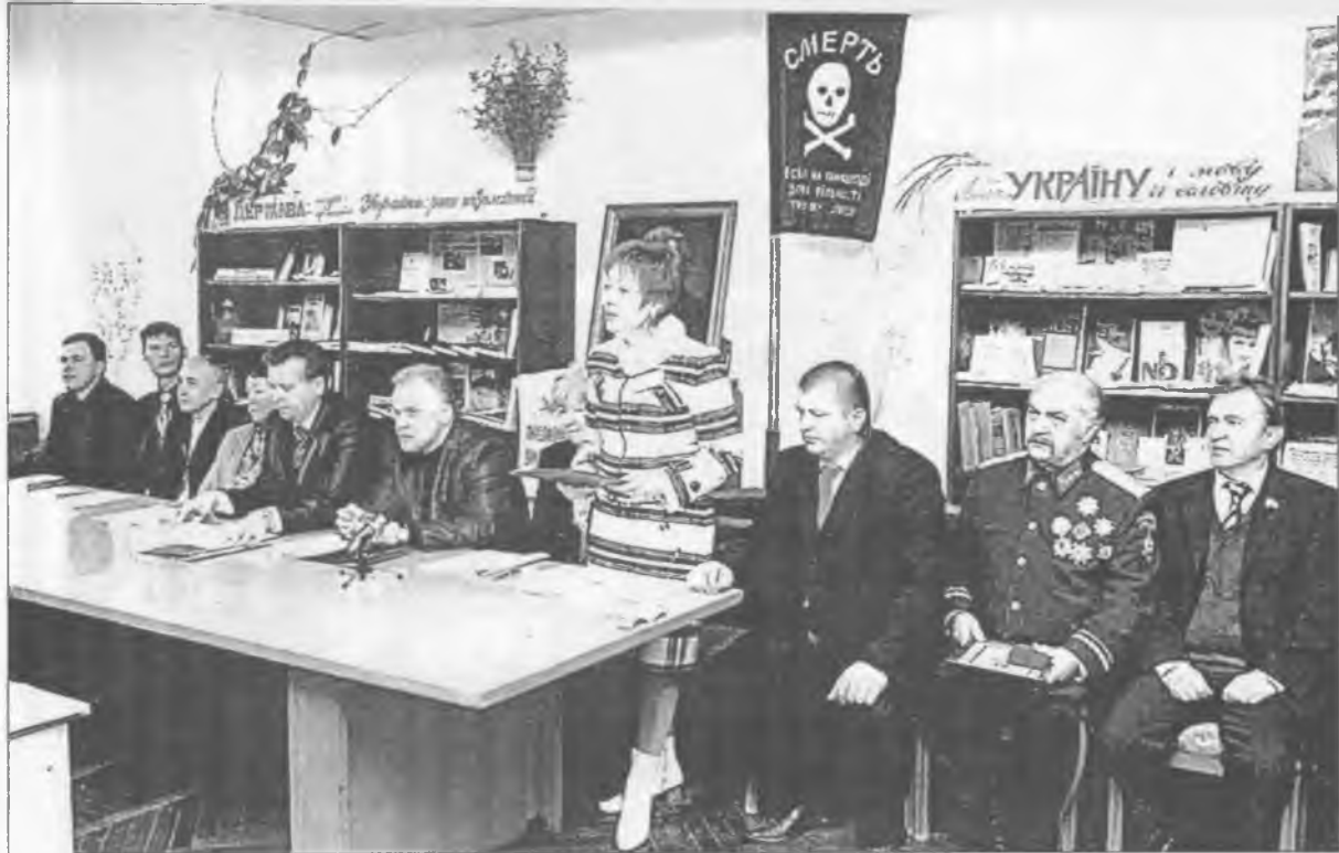
Президія науково-практичної конференції