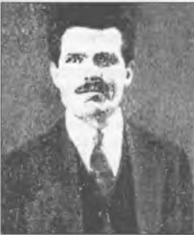
Нестор Іванович Махно в Парижі. 30-ті роки

постійно застерігав від будь-якого співробітництва з політичними партіями, особливо з "більшовиками-комуністами". Оскільки ті неодмінно зрадять революцію. Коли перший вал іспанської революції тимчасово спав і республіканському уряду вдалося стабілізуватися, Махно побачив у цьому помилку самих іспанських анархістів. Перш за все, вони проявили дуже велику терпимість до реформістів у власних рядах, що завадило їм "конкретизувати практичні структури, необхідні для економічної і соціальної організації". Махно бачив у ньому підтвердження власних ідей, висловлених ним раніше (разом з Аршиновим) у "Платформі", яку широко обговорювали в 20-ті роки в міжнародних анархістських колах. Нагадаємо, що в ній була сформована думка про перетворення анархістського руху в значно жорсткішу авангардну організацію з чіткою програмою, єдиною теорією і "тактичною єдністю". (В. В. Дамьє. Махновцы и революционное движение в Европе, с. 24-26, в матеріалах науково-теоретичної конференції "Політична і військова діяльність Нестора Махна". Запоріжжя. 1998).