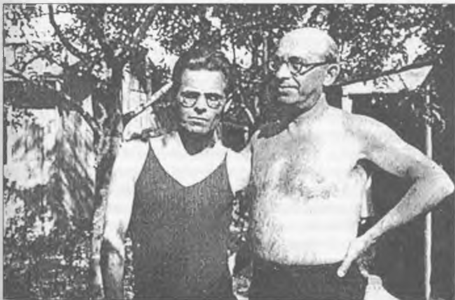
Нестор Іванович Махно в Парижі. 30-ті роки

Звичайно, автору не все вдалося написати так, як хотілося. І це цілком зрозуміло: багатий фактичний матеріал давив на його душу, і все йому здавалося вагомим і важливим. Тому, передбачаючи критику недобррозичливців типу — В. Воліна та іже з ним, Н. І. Махно писав: "Взагалі-то нарис (автор записки називав нарисом — Авт.) повністю відповідає історичній правді про Російську Революцію взагалі і про нашу роль в ній". Точніше і не скажеш.