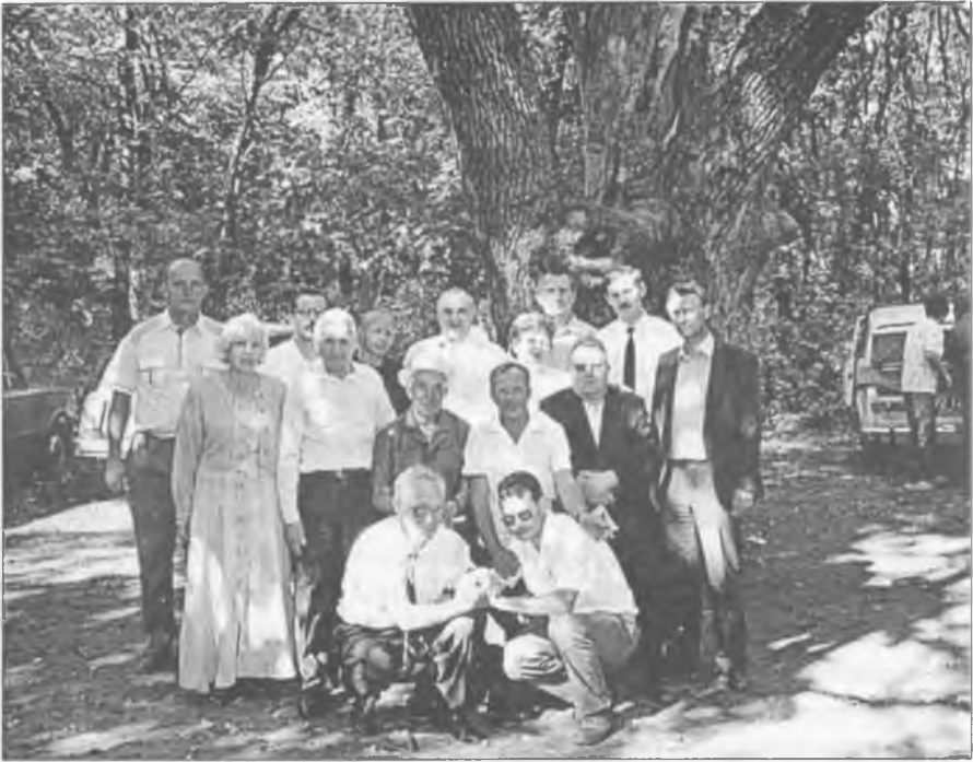
Група учасників зїзду в Дібрівському лісі

Відкрита боротьба з мафією і корупцією подобалась не всім і у 2002 році Анатолій Васильович не пройшов до парламенту. Він став помічником-консультантом у Г. О. Омельченка. І ніхто не здогадувався, що цьому спокійному, врівноваженому, мужньому патріоту залишилося жити зовсім небагато.