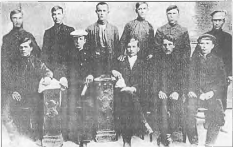
Анархісти-комуністи Гуляй-Поля. 1909 р.

20 березня 1917 року він попрощався з московськими