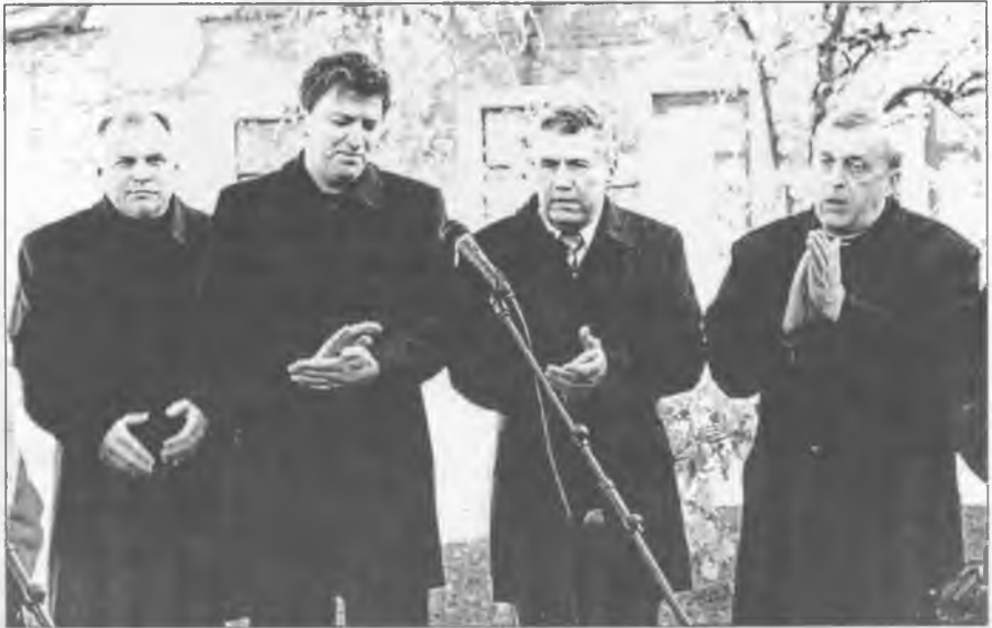
Керівники області і району на урочистому відкритті копії махновської тачанки