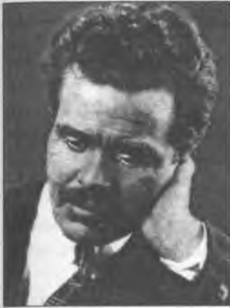
Н. І. Махно в 1933 р.

Так "Гуляйпільський батько" знайшов останній прихисток у французькій землі. Нехай вона буде йому пухом, а сни — солодкі.