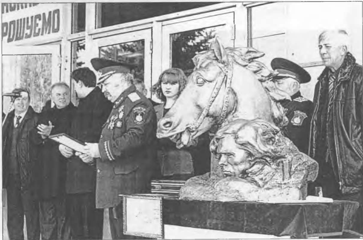
Подарунок гуляйпільцям від козаків Слобожанщини