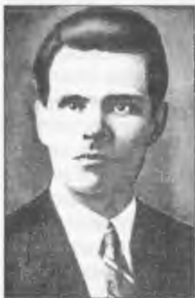
Нестор Іванович Махно. 1909 р.

У березні 1910 року відбувся військово-польовий суд, до смертної кари було засуджено і Махна, і він, як пише: "Начиная с 26 марта 1910 года, нас с товарищами держали в камере смертников. Эта камера с низким сводчатым потолком, шириной в 2 метра и длиной в 5, и еще три таких же находились в подвале Екатеринославской тюрьмы. Только в нашей 23-й камере, кроме Бондаренко, Кириченко, Орлова и меня было еще семь человек...". Так тягнулося 52 доби.