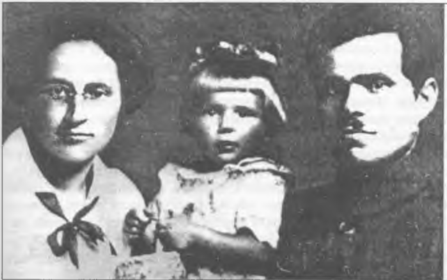
Н. І. Махно з дружиною Г. А. Кузьменко і дочкою Оленкою. м. Париж, 30-ті роки.

Тоді за ідейними переконаннями Кузьменко знали як щирю українку, що стояла за самостійність України і була активісткою Гуляйпільської "Просвіти". І їй дуже імпонував політкаторжанин, борець за волю трудового народу — Нестор Махно.