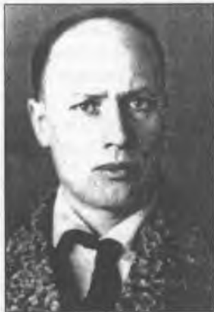
Петро Олексійович Аршинов. 1926 р.

П. А. Аршинов , син робітника м. Катеринослава (тепер — Дніпропетровськ — Авт.) і сам робітник, слюсар за професією. Анархіст, за терористичні акти, як і Махно, був засуджений російським царатом на 20-ть років каторги. В 1911 році у Бутирській в'язниці зустрівся вперше з Махном і став його ідейним учителем. В дні Російської Лютневої революції у перших числах березня 1917 року Аршинов і Махно вийшли на волю.