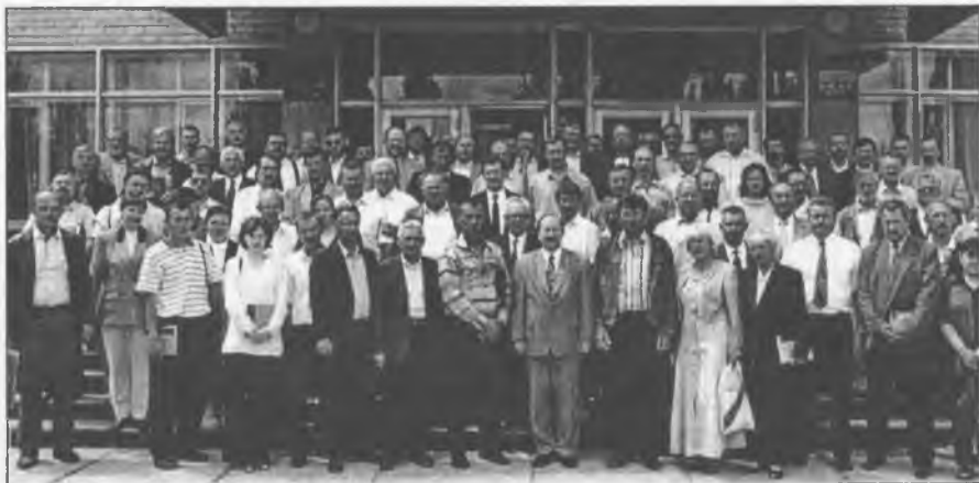
Учасники з'їзду махновців, м. Гуляйполе. 2000-й рік

По завершенні роботи з'їзду делегати і гості здійснили поїздку в Дібрівський ліс до сумнозвісного "Дуба смерті", де почув-ли чимало цікавого від місцевого краєзнавця О. Л. Лапка про Мах-на і махновців.