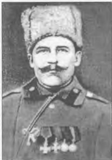
Трохим Якович Вдовиченко

Серед відомих махновців почесне місце займає ВДОВИЧЕНКО Трохим Якович .