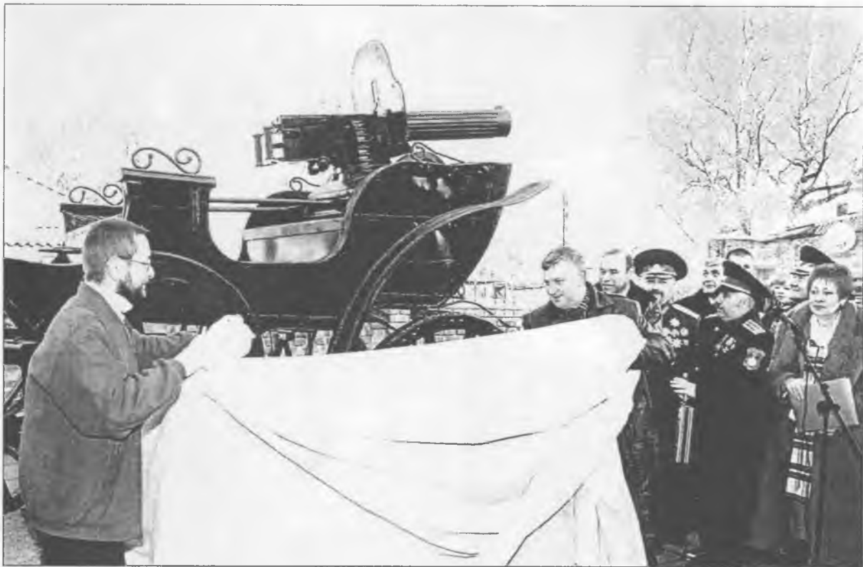
Ось вона знаменита махновська тачанка