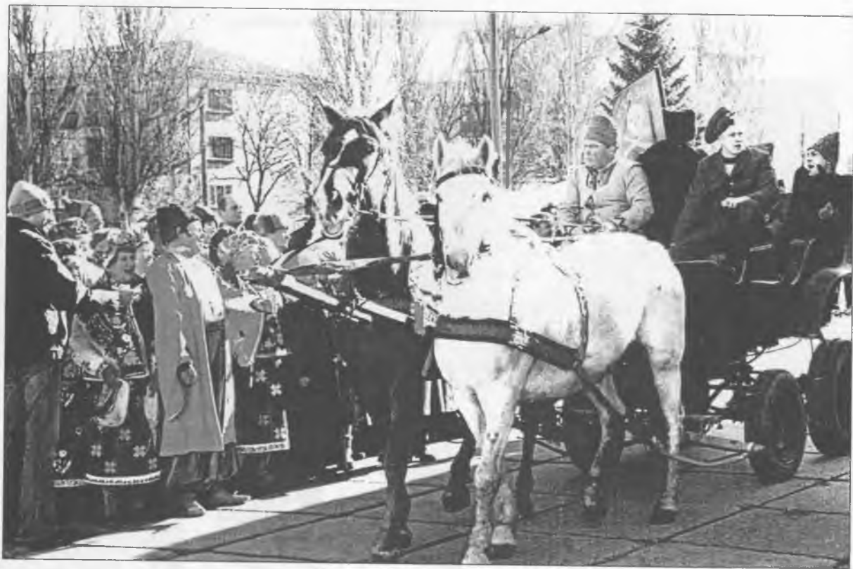
Махновці в місті