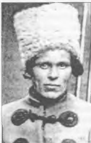
Нестор Іванович Махно. 1919 р.

Починаючи з січня 1919 року, махновці утворили перший протиденікінський фронт і шість місяців стримували потік контрреволюції, який лився з Кавказу. Фронт розтягнувся потім на сто з лишком верст, від Маріуполя на схід і північний схід. Махновські частини займали міста Бердянськ, Маріуполь, гнали частини генерала Шкурко до Таганрога і Ростова-на-Дону. В цей час яскраво проявився військовий талант Махна. Славу талановитого військового начальника визнали і його вороги — денікінці. Генерал Денікін обіцяв півмільйона тому, хто уб'є Махна.