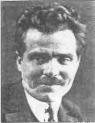
Н. І. Махно в 1932 р.

Я взяла дочку, спустилась до завідуючої і заявила, що я зараз же з дочкою їду в Париж, в госпіталь, так як батько моєї дочки і мій чоловік помирає.