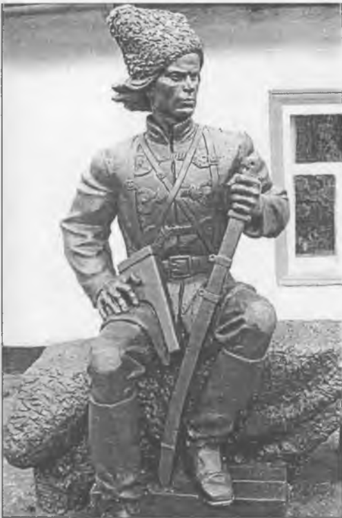
Пам'ятник Н. І. Махну в Гуляйполі на вул. Трудовій, 144. 8.XI.2008 р.

— Скульптура поки що в гіпсі, — розповідав запорізький скульптор Владлен Дубінін. — Але сподіваюся, що зможемо замінити його на ковку та бетон. Та на це треба грошей. А якби вдалося відлити в бронзі — ото був би клас! Потім розі'ємо перед хатою сад, тут виросте шовкова трава... Дуже переживаю, щоб Махно тут добре влаштувався. Нехай йому буде спокійно.