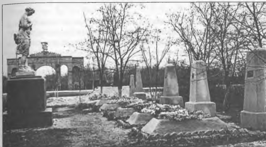
Гуляйпільське братське кладовище, де поховані перші жертви революції — 45 робітників і селян із махновського загону самооборони, підступно порубані білими під залізничною станцією Гуляйполе. Фото 1965 р.

радянської влади. Так далі продовжуватися не може; робота місцевих надзвичайок без сумніву провалює фронт і зводить на ніщо всі військові успіхи, створюючи таку контрреволюцію, яку ні Денікін, ні Краснов ніколи створити не могли".