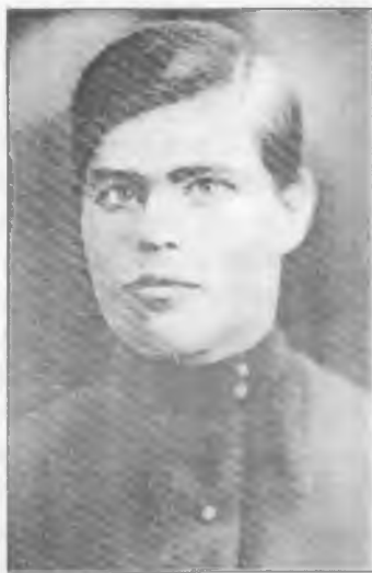
Нестор Махно. 1906 р.

В начале 1906 года я случайно познакомился с маленькой группой крес-