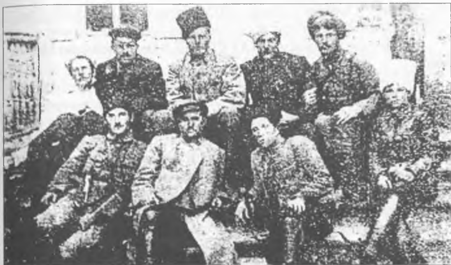
Головний штаб Махна