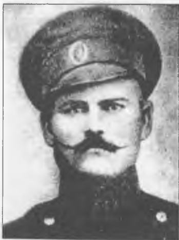
Омельян Іванович Махно

22 травня 1918 року першим австрійські окупанти розстріляли в Гуляйполі Омелька Івановича Махна.