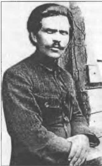
Нестор Іванович Махно в Румунії. 1921 р.

Отже, перед махновцями стояв вибір: або здатися на милість радянської влади, або залишити Україну і податися за кордон. Більшість вирішила залишитися на рідній землі, сподіваючись, що лихо їм обмине.