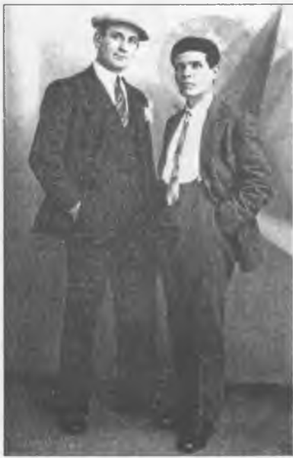
Василь Харламов (зліва) і Нестор Махно в Парижі