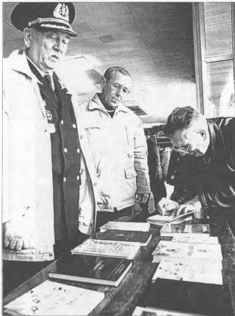
Автограф на пам'ять від самого автора