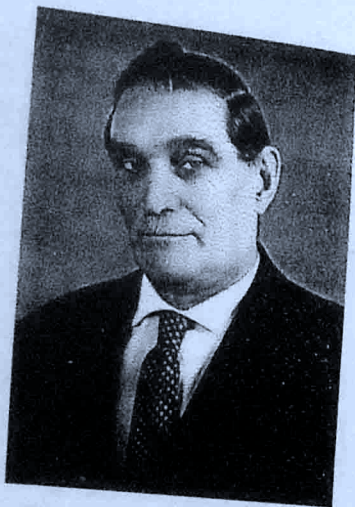
Проф. д-р Петро Курінний

Ця праця проф. Петра Курінного , сподіваємось, буде настільною книгою кожного археолога України. Її репринтне перевидання засобами оперативного друку здійснене Центром охорони та досліджень пам'яток археології управління культури Полтавської обласної державної адміністрації.