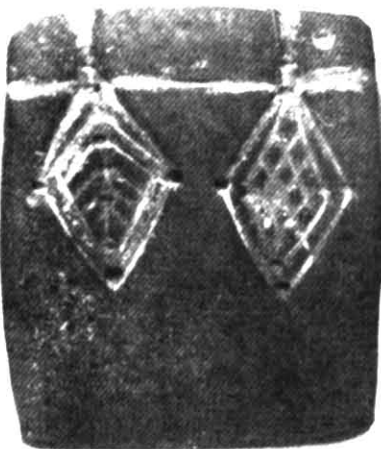
Рис. 2. Ливарна формочка з с. Андріївка (фото).

вчених ми маємо досить чітке уявлення про форми та методи організації бронзоліварного виробництва. Продовжуючи вищезазначену тематику, публікація має на меті ознайомити спеціалістів з цікавою знахідкою ливарної формочки, виявленої поблизу селища Андріївка Волновахського р-ну Донецької обл. Вона належить до розряду випадкових, тому що зафіксувати поблизу ще якісь речі матеріального комплексу не вдалось. Формочку було зроблено з арделіту (представлено лише однією стулкою), вона має трапецієподібний обрис довжиною — 55, шириною у найменшій частині — 43, у найбільшій — 45 мм, найбільша товщина — 14 мм.