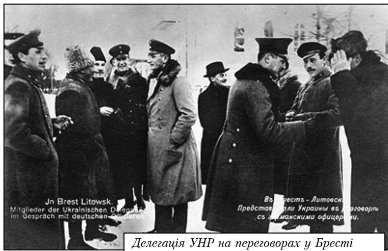
Делегація УНР на переговорах у Бресті

Якщо Німеччина після підписання миру могла відразу перейти до здійснення заходів щодо української проблеми, то Австро-Угорщина постала перед протестами поляків, що набули несподівано великих масштабів і змусили віденський уряд зосередити зусилля на упередженні серйозної внутрішньополітичної кризи. Зокрема, Регентська рада у Варшаві заявила протест проти укладення Брестського миру, уряд Кухаржевського, військовий генерал-губернатор граф С. Шептицький і всі поляки – міністри австро-угорського уряду – демонстративно подали у відставку [15]. 15 лютого збунтувалися усі частини польського легіону, і практично по всій Галичині розпочалися демонстрації поляків під «антидержавними й антидинастичними гаслами», які тривали до кінця березня [16]. Однією з причин настільки масових протестів стало те, що члени української делегації у Бресті, попри домовленість тримати секретні протоколи про відступлення Холмщини й поділ Галичини у таємниці, на шляху до Відня, де мали відбутися переговори про австрійську воєнну допомогу, не втрималися від спокуси повідомити львівським побратимам про ці рішення. Складно встановити, хто без-