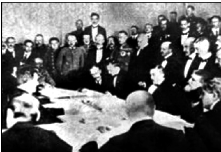
Під час Брест-Литовських мирних переговорів, січень 1918 р.

Після того, як 16 лютого Німеччина анулювала перемир'я з радянською Росією, а через день її війська розпочали наступ на Петроград і вторгнення в Україну, у Відні було офіційно прийнято прохання делегації УНР надати «збройну допомогу в межах України проти просування більшовицьких сил» [17]. Утім, граф О. фон Чернін не погоджувався гарантувати військову допомогу до отримання суттєвої поступки щодо лінії польсько-українського кордону. Тому того ж дня О. Севрюк був змушений підписати доповнення до параграфу про визначення лінії кордону, визнавши можливість її відсунення на схід [13, 48–49]. Однак рішення Німеччини увійти в українські терени змусило австро-угорську сторону поквартитися з початком власної військової