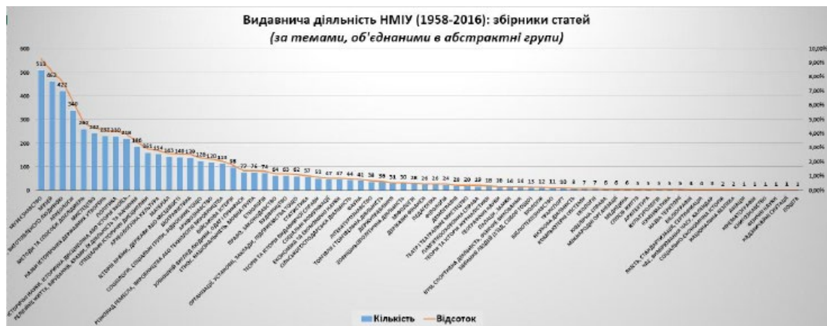
Рис. 4. Видавнича діяльність НМІУ (1958–2016) за темами, об'єднаними в абстрактні групи

В аналогічний спосіб об'єднано в абстрактні групи теми статей зі збірників НМІУ (рис. 4.; перші 20 таких груп представлено в табл. 5, курсивом позначено теми, які НЕ розглядалися також у збірниках МІКУ – С. К.). В цьому випадку коло тем інше, оскільки дослідники зосереджувалися на таких питаннях, як: музеєзнавство (9,30% статей); музеї та їхня історія (8,41%); різновиди виготовлених людиною предметів (7,68%); археологія, її історія, розкопки, знахідки та дослідження (6,19%); методи і способи дослідження (4,73%); мистецтво (4,41%); історичні державні утворення (4,22%). Частими для збірників НМІУ, але не для МІКУ, є такі теми: політика; археологічні культури; різні матеріали; питання соціології, соціальних груп, відносин тощо; архівознавство; військова історія. Рідкісними темами в збірниках статей НМІУ є: ювелірна справа, міжнародні організації, медицина, спосіб життя, архітектура, культурологія, назва території, бібліографія, якість, стандартизація і сертифікація, час, вимірювання часу та календар, соціально-економічна історія, національна безпека, авіація, кінематографія, книгознавство, фізичні науки, надзвичайні ситуації, пошта. На нашу думку, ці теми потребують детальнішого вивчення.