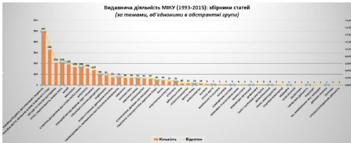
Рис. 3. Видавнича діяльність МІКУ (1993–2015) за темами, об'єднаними в абстрактні групи

Оскільки конкретних тем виявилось багато, деякі теми статей зі збірників МІКУ, якщо вони мали спільні родові ознаки, було об'єднано в абстрактні групи (рис. 3; перші 20 груп представлено в табл. 4, курсивом позначено теми, які НЕ зустрічаються у збірниках НМІУ), які дають можливість зрозуміти, що саме вивчали науковці, розвідки яких публікували у збірниках МІКУ. Найбільше статей присвячено: різновидам виготовлених людиною предметів (16,56% статей); темам, пов'язаним із релігійним життям, віруваннями, храмами та їхньою діяльністю, культом тощо (10,96%); методам і способам досліджень (7%); етносам, етнічним групам, націям та національностям, мовним групам (7%); власне музеям і їхній історії (6,40%); питанням мистецтва (5,6%); історичним наукам, історичним дисциплінам та історії конкретної науки (5,6%); археології та її історії, археологічним розкопкам і дослідженням (5,2%) тощо. Деякі теми з перших 20 абстрактних груп зі збірників МІКУ не збігаються з темами, об'єднаними в абстрактні групи, зі збірників НМІУ. Рідкісними темами в збірниках МІКУ є: економіка та економічні науки, міська історія, міжнародні організації, демографія, театр і театральне мистецтво, держуправління, право і законодавство, соціальні комунікації, медицина, культурологія, бібліографія, торговельна діяльність, транспорт, час, вимірювання часу та календар, державні фінанси, політика, сільськогосподарська діяльність. На нашу думку, дослідникам слід звернути увагу на них.