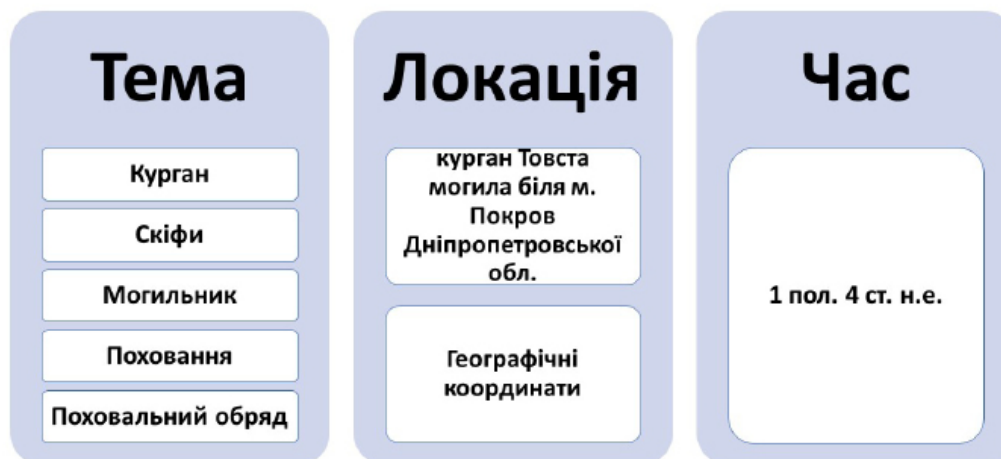
Рис. 2. Приклад основних даних, що збиралися, відповідно до гіпотези “тема – локація – час”

Одним із результатів нашого дослідження стала розробка двох відкритих онлайн баз даних: а) статей зі збірників НМІУ (659 за 1958–2016 рр.) 5 та б) матеріалів конференцій МІКУ (606 статей за 1993–2015 рр.) 6 . Обидві бази даних розроблені і створені нами для користування як співробітниками НМІУ, так і для широкого загалу. Паралельно було оцифровано всі збірники статей і матеріалів наукових конференцій, включені до цих баз даних 7,8 . Це, зокрема, має сприяти популяризації серед наукової спільноти опублікованих видань НМІУ, які виходили переважно невеликим накладом. Бібліографічні дані всіх статей були додані нами до наукометричної бази Google Scholar, що також сприятиме поширенню наукового доробку музею серед наукової спільноти.