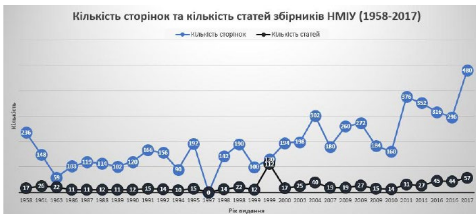
Рис. 1. Кількість сторінок та кількість статей у виданнях НМІУ за 1958–2017 рр. 3

У кожному новому виданні збільшувалася кількість сторінок і статей. І це – єдиний параметр, безперервність якого можна простежити. Кількість обліково-видавничих аркушів також збільшувалася, але маємо інформацію лише за деякі роки, що не дає можливості з’ясувати реальний обсяг матеріалу для всіх видань.