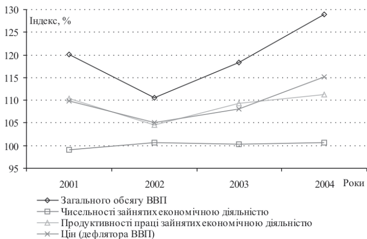
Рис. 2. Динаміка вартості ВВП, чисельності зайнятих та продуктивності їх праці за 2001-2004 роки

Наведені у табл. 8 дані про динаміку індексів обсягу валового внутрішнього продукту, чисельності зайнятих та продуктивності їх праці відобразимо також графічно (рис. 2).