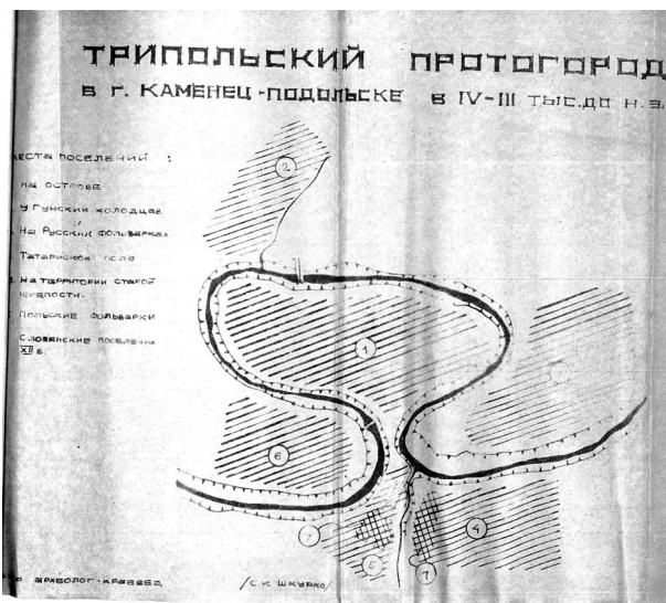
Рис. 1. Поселення трипільців на території Кам'янець-Подільського та його околиць (схема С.К.Шкурка)

в особовому фонді Р-4804 краєзнавця С.К.Шкурка, збереглась справа в якій містяться матеріали про археологічні розкопки і виявлення кераміки трипільського часу в Кам'янці-Подільському [12; 5]. Серед іконографічних та бібліографічних джерел присвячених археологічним дослідженням Кам'янець-Подільського особливу увагу привертає унікальний, але на жаль, не відомий план археологічних розвідок, де вказано місця знахідок на території Старого міста. План виконано на ватмані розміром 25x40 см. Малюнки підписано краєзнавцем С.К.Шкурком, вміщено авторські анотації у вигляді машинописного тексту, які містять відомості про місце проведення розкопок та знаходження об'єктів і їх короткий опис.