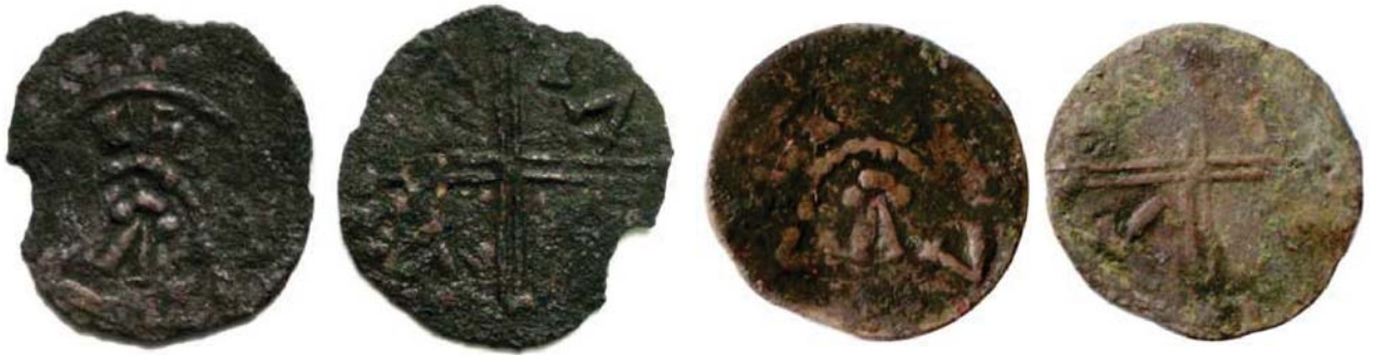
Рис. 1. Фальшивий денарій № 1.