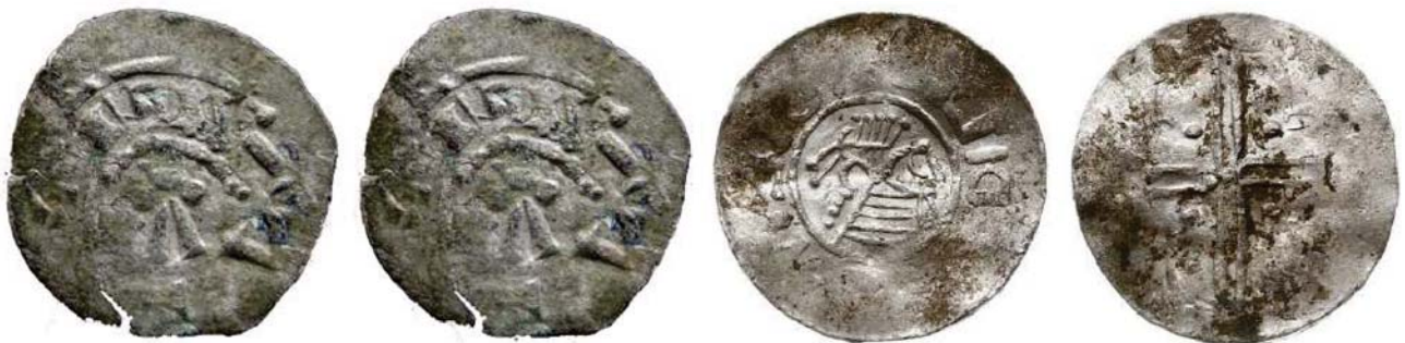
Рис. 3. Фальшивий денарій № 3.