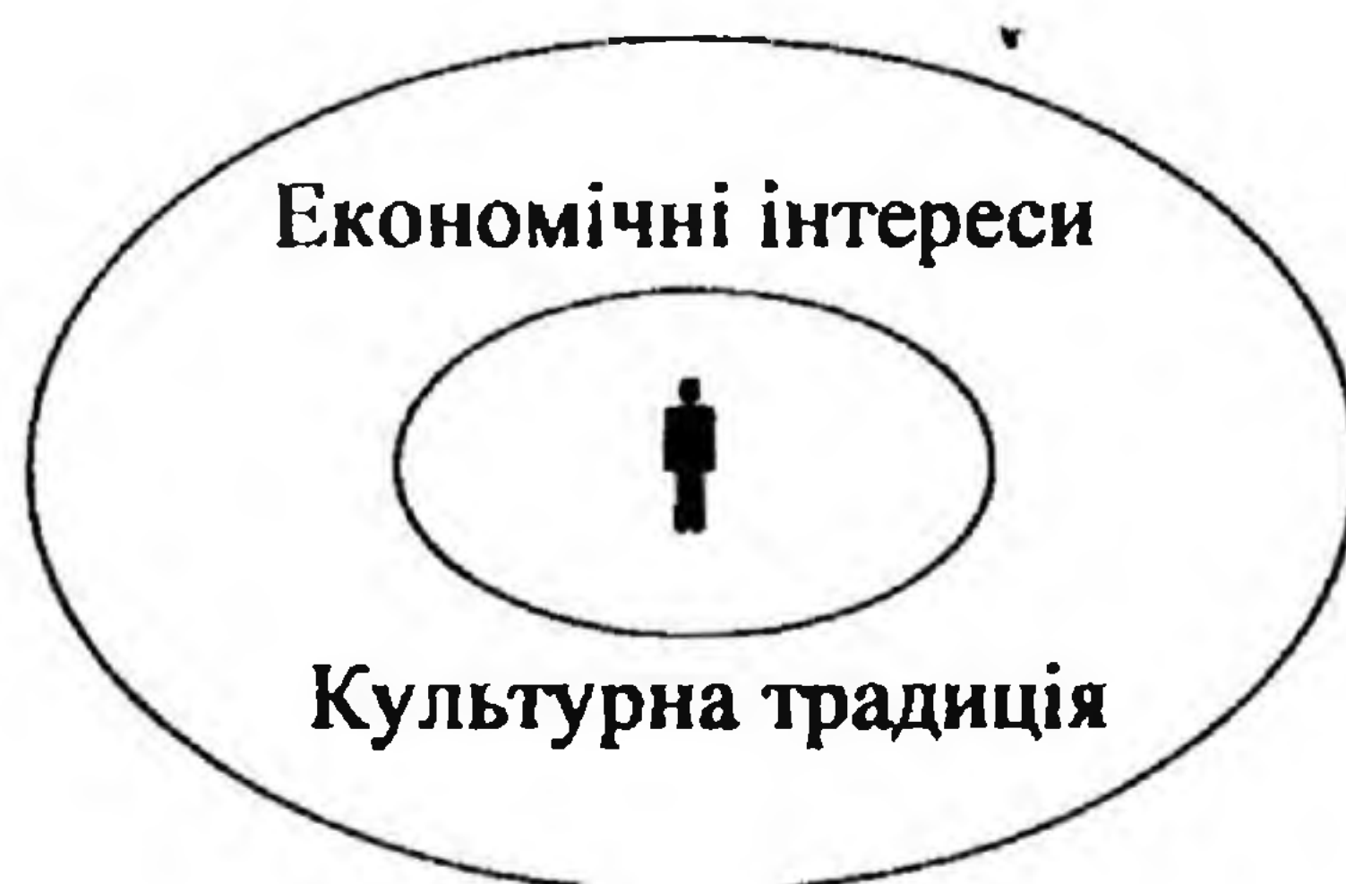
Рис. 3.1. Взаємозалежність системи культури та економічних інтересів у будь-якій економічній системі

поведінки людини у суспільстві, її економічними потребами та інтересами, візуально можна висловити таким чином: