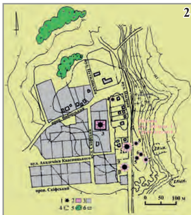
До статті Олександра Супруненка, Ірини Кулатової «Старожитності Яківчанської гори»:

Рис. 1. Група курганів. Полтава, м., Дальні Яківці, с-ше, Нагірна та Академіка Квасницького вул. Карта розташування.