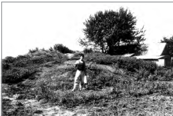
Рис. 5. Група курганів. Полтава, м., Нагірна вул., 1. Курган № 2. Фото 1991 р. Зі сходу.

Група курганів знаходиться на мисоподібному виступі плато правого корінного берега р. Ворскли у північно-східній частині селища Дальні Яківці (одного з мікрорайонів Полтави), біля старого Яківчанського кладо-