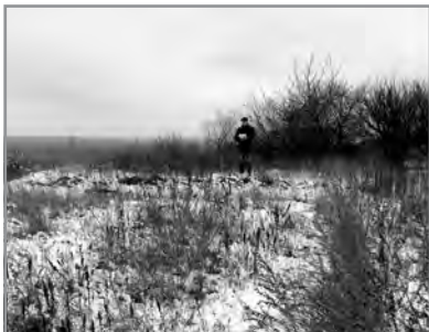
Рис. 10. Група курганів. Полтава, м., Нагірна вул., 1. Курган № 7. З північного заходу.