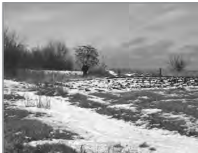
Рис. 11. Група курганів. Полтава, м., Нагірна вул., 3–5. Курган № 8. Рештки насипу. З південного заходу.

йону міста, у с-щі Дальні Яківці, по вул. Академіка Квасницького, у лісовому масиві (рис. 1; 3; 12).