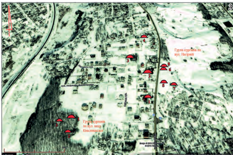
Рис. 3. Група курганів. Полтава, м., Нагірна та Академіка Квасницького вул. За космічним фотознімком.

Рис. 2. Група курганів. Полтава, м., Нагірна вул. Генеральний план.