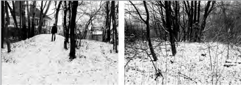
Рис. 13-14. Група курганів. Полтава, м., Акад. Квасницького вул. Насипи № 1-2. З північного заходу.

об'єкти, що знаходилися на території парку М. В. Скліфосовського. Симптоматично також, що наявність цих та сусідніх курганів у 1990-х рр. стала вже згаданим приводом до появи у Полтаві окремої вулиці — Курганної, що знаходиться з північного боку від групи.