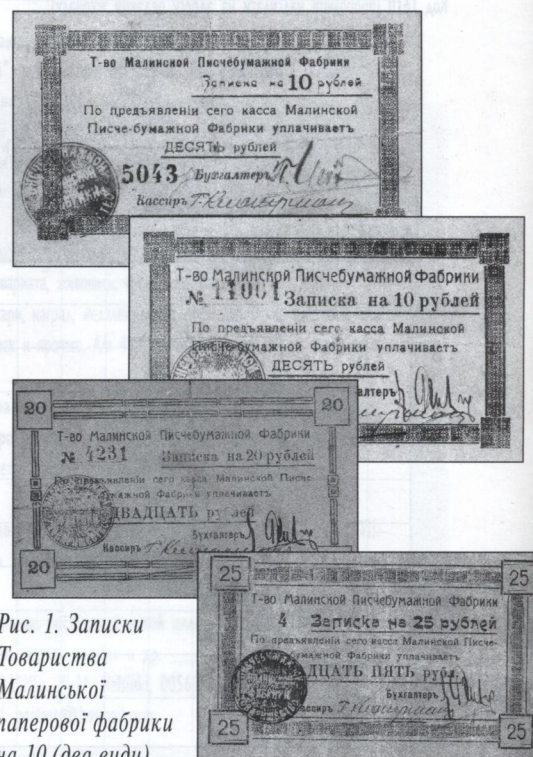
Рис. 1. Залписки Товариства Малинської паперової фабрики на 10 (два види), 20 та 25 рублів.

* Якщо хтось із боністів має щодо цього інформацію, автор буде ширю вдячний за її надання.