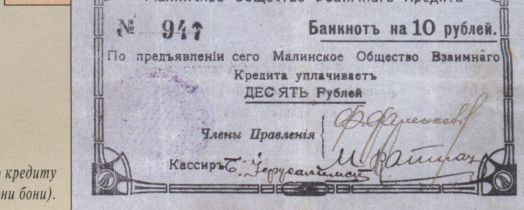
Рис. 7. Банкноты Малинского Товариства Взаимного кредиту на 5 та 10 рублів (зовсім різні рамки лицьової сторони бони).