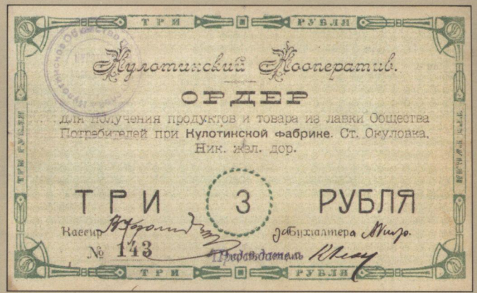
Рис. 8. Бона Вельского Союза Кооперативів (1000 рублів), Ордер Кулотинського кооперативу ст. Оку ловка (3 рублі) та банкнот Товариства Взаємного Кредиту (1 рубль) - схожі рамки на лицьовій стороні.