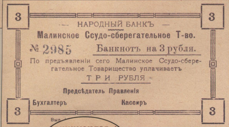
Рис. 2. Банкноты Народного банку на 3 рубля (помилка на зворотній стороні: у слові "текущие" ("текущие)).