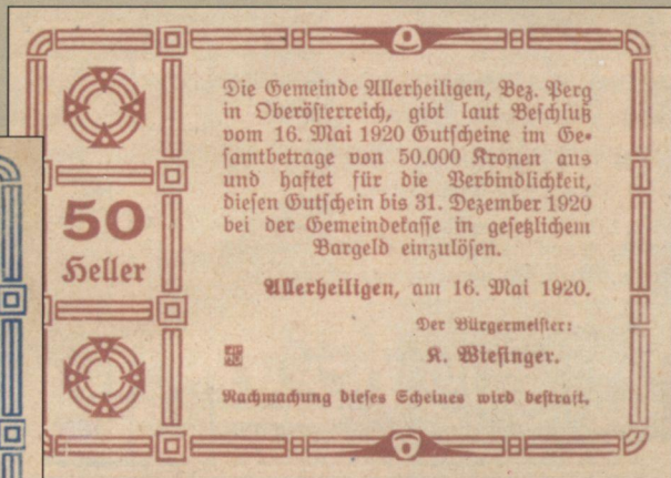
Рис. 9. Нотгельди общин австрійського міста Аллерхейліген (20 і 50 хеллерів) та магістрата міста Барут (5 пфеннігів) Німеччина (схожі фрагменти рамок).