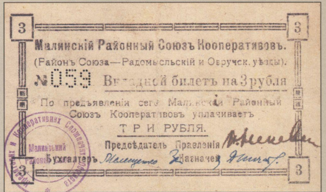
Рис. 5. Вкладний білет Малинского Районного Союзу кооператорів (3 рублі).