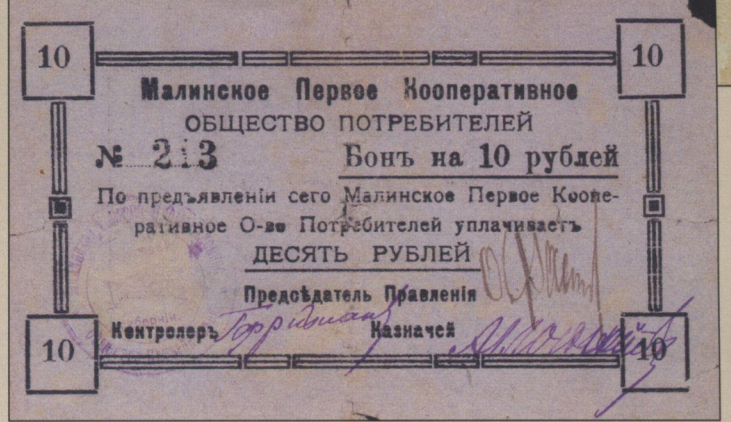
Рис. 3. Бони Малинского Першого Кооперативного Товариства Споживачів на 3 та 10 рублів.