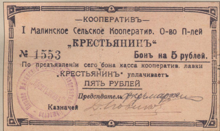
Рис. 6. Бон кооперативу "Крестьянин" (5 рублів).