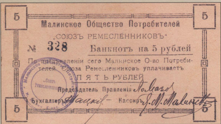
Рис. 4. Банкнот Малинского Товариства Споживачів (5 рублів).

Рис. 3. Бони Малинского Першого Кооперативного Товариства Споживачів на 3 та 10 рублів.