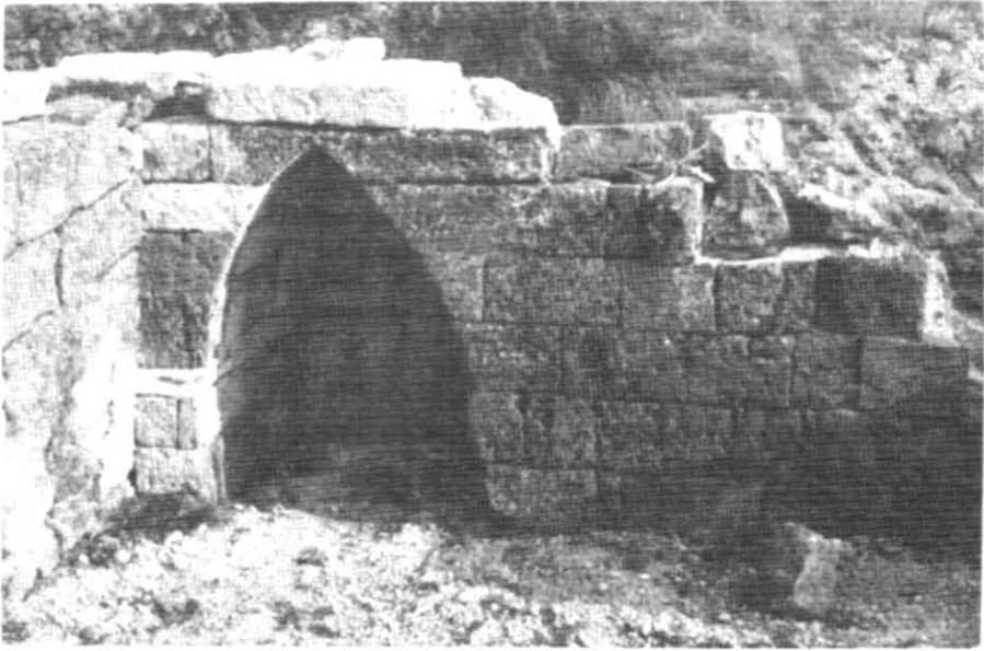
Рис. 2. Будинок Е-5. Східна ніша після реставрації