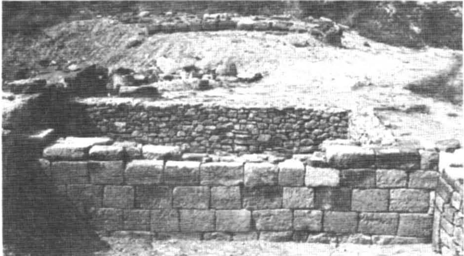
Рис. 3. Будинок Е-5. Підвали V, VI після реставрації

Методика, яку ми використовуємо, безперечно, потребує подальшого удосконалення, проте на сучасному рівні розвитку консервації і реставрації будівельних залишків вона, очевидно, найперспективніша.