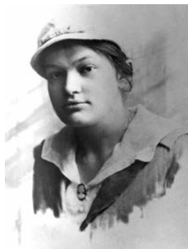
Катерина Грушевська. Друга половина 1920-х рр.