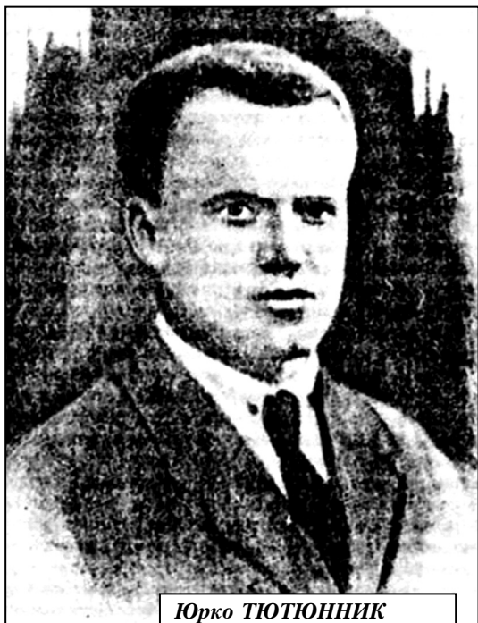
Юрко ТЮТЮННИК генерал-хорунжий УНР

Діяльність референтури військового керування була зосереджена на організації, підготовці та проведенні збройного антибільшовицького повстання в Україні. Саме на цю референтуру припадала лівова частка всієї підготовчої роботи, і тільки вона мала розгалужену структуру, складаючись із трьох відділів: I-й (Організаційний),