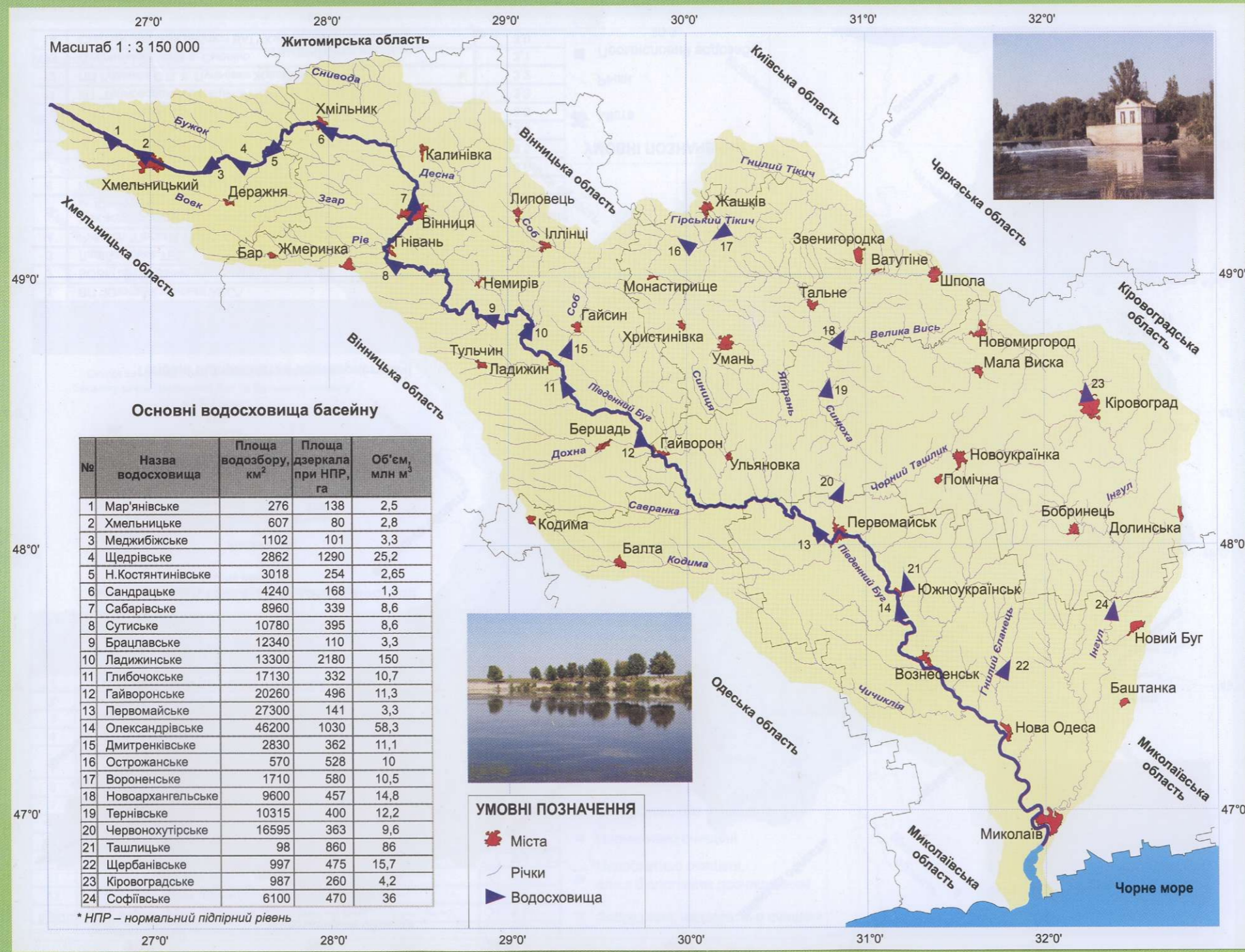
Основні водосховища басейну