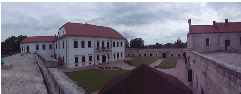
Zamek w Zbarażu, stan z 2016 roku, fot. T. Błaszczuk.