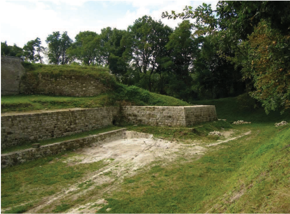
Zbaraż, stan z 2008 roku, fot. T. Błaszczyk.