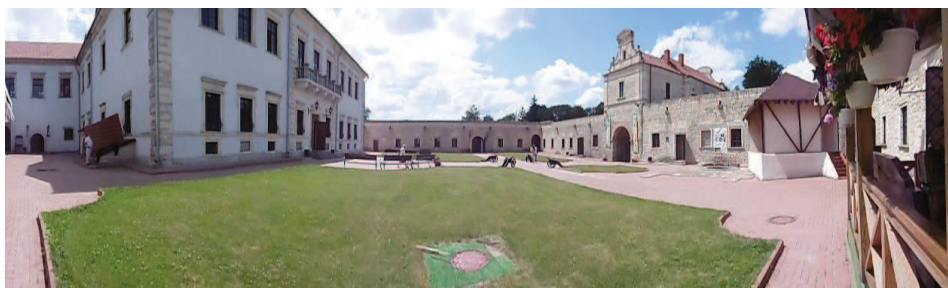
Zamek w Zbarażu, stan z 2016 roku, fot. T. Błaszczuk.