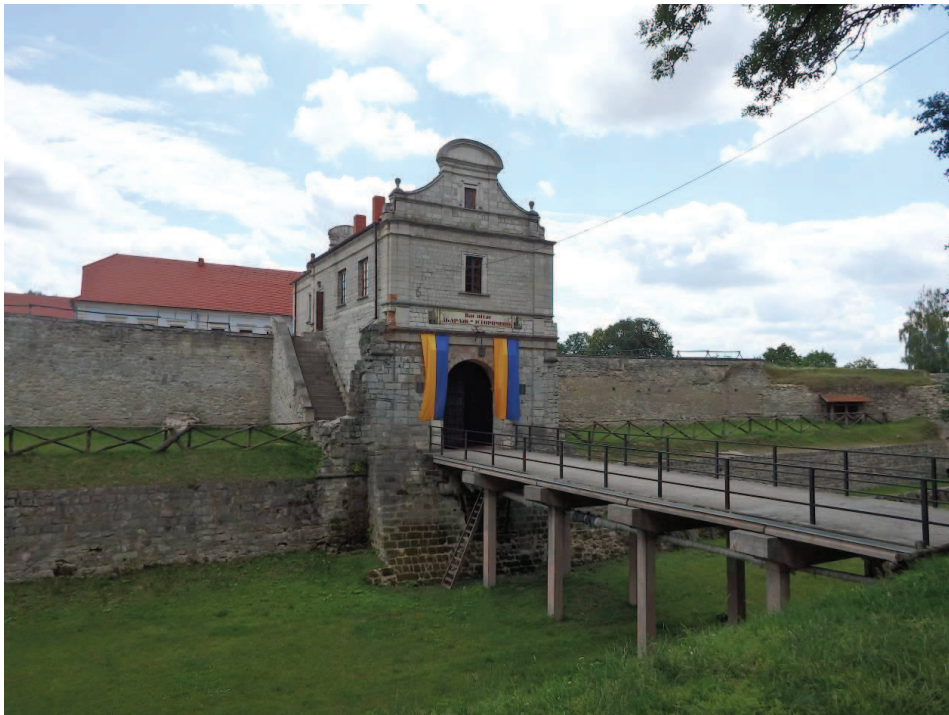
Widok na bramę wjazdową zamku w Zbarażu, stan z 2016 roku, fot. T. Błaszczyk.