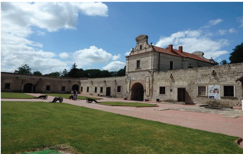
Widok na bramę wjazdową zamku zbaraskiego, stan z roku 2016, fot. T. Błaszczyk.