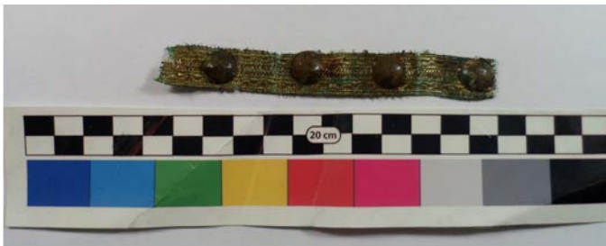
Рис. 1 (б). Тасьма з металевою (золотною) ниткою