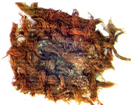
Рис. 3 (а). Текстиль простого (полотняного) переплетення (збільшення в 20 разів)