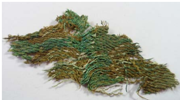
Рис. 2 (б). Текстиль складної фактури з золотою ниткою