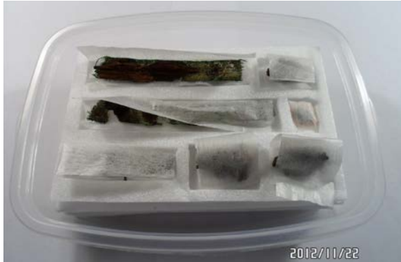
Рис. 1 (а). Індивідуальне пакування археологічного матеріалу в боксах з хімічно нейтрального пластику