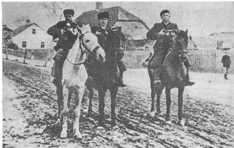
Група розвідників бригади у визволеному партизанами польському селі. 1944 р.