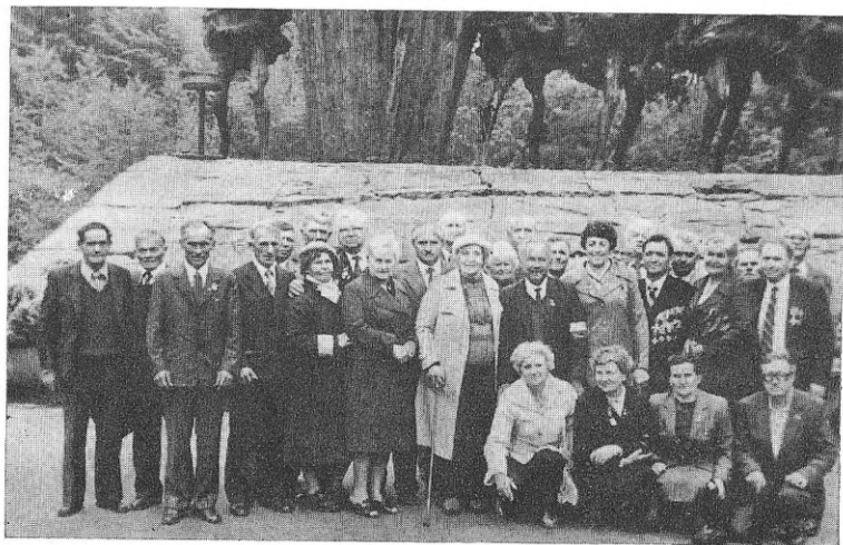
Група колишніх партизанів бригади на зустрічі в Яновських лісах з нагоди 40-річчя битви. 1984 р.