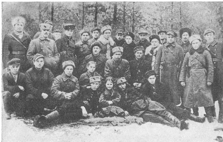
Група командирів і партизанів бригади. 1944 р.