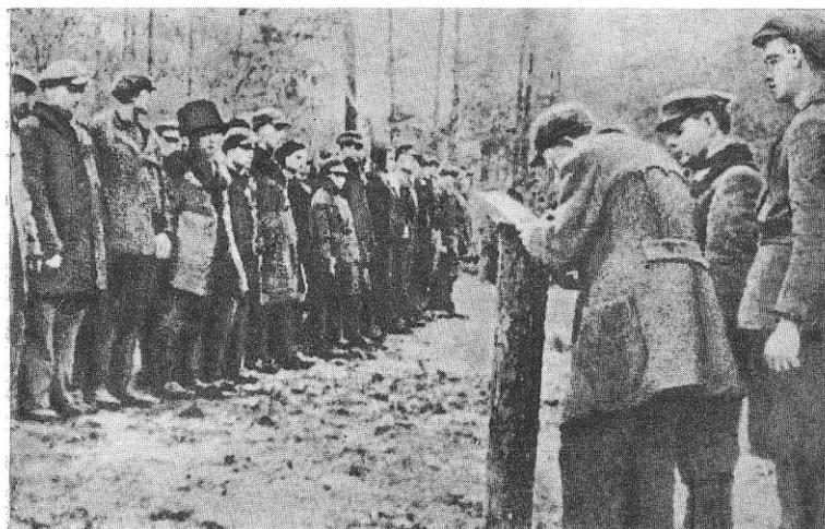
Партизани бригади приймають присягу