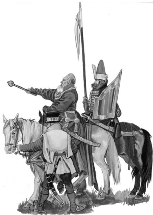
Князь Костянтин Іванович Острозький під Оршею.