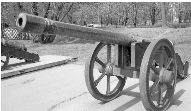
Гармата 1529 року.