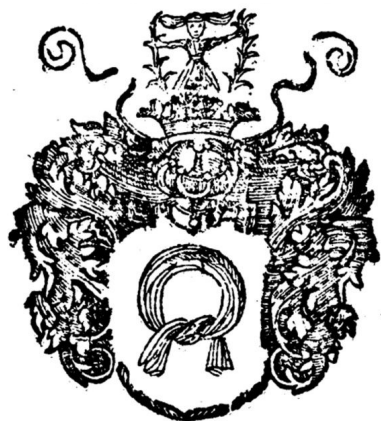
Ил.9. Герб «Наленч», Orbis polonus, Vol.2

версія виглядає сумнівною з огляду на те, що у геральдиці Могил присутній питомо молдавський герб з туром, що має кільце в носі; до того ж, з його появою нібито пов'язана легенда мисливського змісту (Однороженко 2009, Руські королівські, господарські і князівські печатки... , с. 224-227). Саме це зображення можна побачити на гербі Петра Могили, двоюрідного брата Раїни Могилянки-Вишневецької. Прилуцький герб все ж дуже подібний до «Помяна» (Гречило 1998, с. 61).