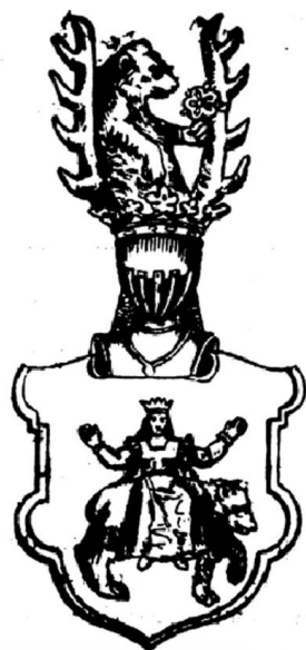
Ил. 10. Герб «Равич» з гербовника Б. Папроцького

Менш відомі герби з мисливськими сюжетами з переліку наданих у 1413 р.. Окремо варто згадати про герби з мисливськими трофеями, які були достатньо відомими на Волині та Київщині, та деякі герби зі списку 1413 р., які лишились малознаними на цих теренах. До відомих мисливських трофеїв належать роги оленя або лося, які досить часто можна побачити у нашоломниках гербів ранньомодерного часу. Роги оленя є типовою прикрасою мисливської вітальні у палаці чи замку, або ж мисливського будиночка (Büttner 2010, S. 18). Це і не дивно – ще в часи Середньовіччя на Заході Європи від впливом Церкви стало популярним полювання на оленя, яке прийшло на зміну гонитві на вепра, що вважалось відголоском обряду ініціації. Позиція Церкви була зумовлена тим, що у полюванні на граційного оленя людина проявляє менше жорстокості, і воно безпечніше для неї самої (Пастуро 2010). До того ж, воно присутнє в житіях святих Остафія та Губерта.