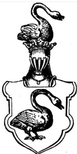
Іл. 5. Герб «Лебідь» з гербовника Б. Папроцького

походження зустрічається частіше, проте обидві ці легенди мають пізні походження (Okolski ? Vol.3, p. 224).