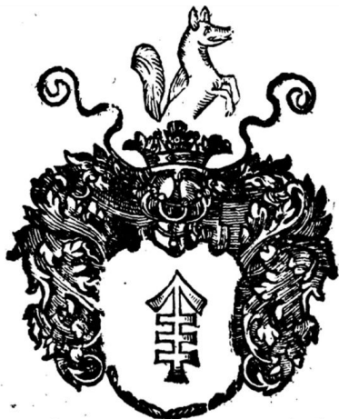
Іл. 6. Герб «Лис», Orbis polonus, Vol.2