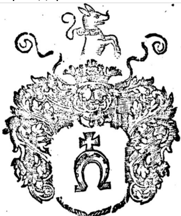
Іл. 2. Герб «Побуг», Orbis polonus, Vol.2.

Попри популярність угорської вижли в якості клейноду, представники деяких шляхетських родів лишили замість песика поширене в геральдиці павичеве пір'я. Тож такий герб доречніше називати «Три вруби». Саме так виглядає герб панів Мелешковичів, білоруського роду, що мав маєтки на Волині та Київщині. Також варто навести приклад волинян Коритенських, де також в клейноді зустрічається пір'я павича, а на нижній частині щита, під врубами, півмісяць. Подібно до цієї родини, пір'я павича замість песика в клейноді і звичні вруби на щиті мали на своєму гербі пани Кміти-Чорнобильські з Київщини (Однороженко 2009, Українська родова геральдика , с. 277). Натомість на «Корчаку» волинських шляхтичів Добронізьких під трьома врубами на щиті вміщений мисливський ріжок (Однороженко 2009, Українська родова геральдика , с. 226). Окрім вищеназваних шляхетських родів, цим гербом, власне з трьома