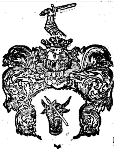
Іл. 8. Герб «Помян», Orbis polonus , Vol.2.

Ще одним відомим польським гербом зі списку 1413 р. і з зображенням дикої тварини є «Помян», на щиті якого голова зубра, проткнута мечем; за легендою, під час князівського полювання один із шляхтичів, представників гербу «Венява» (цей герб поза вищезгаданим списком), поцілів у зубра мечем, за що отримав такий герб на згадку (Paprocki 1858, s. 536). Полювання на представників родини бикових, а саме зубра та тура, ще в часи Середньовіччя було привілеєю еліт, тож у зазначений час ці звірі встигли стати рідкісними (Samsonowicz 2011, s. 64-66). Згаданий вище зубр, великий та сильний звір, взагалі вважався володарем лісу - полювання на нього було дуже складним, до того ж, наповнене символізмом, найкращим доказом чого є латиномовна поема поета Миколая Гусовського (бл. 1470 – після 1533 рр.) «Пісня про зубра» (Гісторыя... 2010, с. 326-336.).