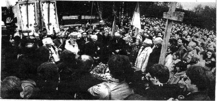
Освячення місця під побудову Лемківської церкви у Шевченківського гаю 7 квітня 1991р. Відправу здійснили Блаженніший Мирослав Іван кардинал Любачівський та митрополит Володимир Стернюк.

Львівського скансену лемківської церкви з с.Гирова біля Дуклі були безрезультатними.