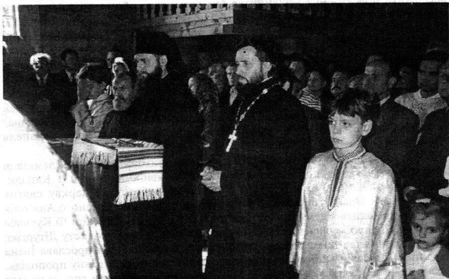
Вітання 13 вересня 1992 р. складають о.о.Студити.

Лемківщини /ФДЛ/. Було затверджено Статут Фундації. Новостворену організацію зареєстровано у Львівській міській Раді народних депутатів 10 квітня 1992 р. Незабаром головою правління обрано І.Красовського. ФДЛ успішно розпочала свою роботу.