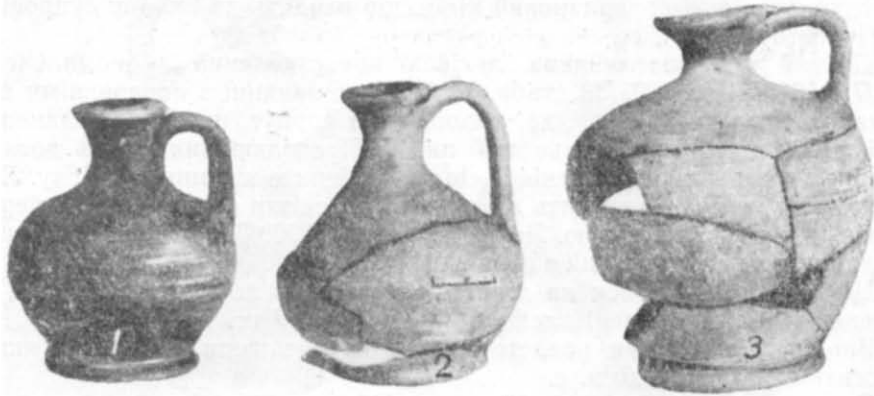
Таблиця VI. Сіроглиняні лекіфи.

Тому недбалість обробки, примітивність та шаблонність розпису, а також грубість матеріалу не можуть правити за єдиний критерій при датуванні кераміки та визначенні місця виробництва. Нехтуючи цим, деякі дослідники помилково значно занижували час існування тієї чи