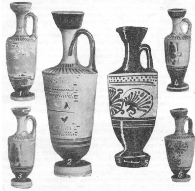
Таблиця 1. Чорнофігурні лекіфи.

В класичному некрополі Ольвії представлені чорнофігурні лекіфи найпізнішого стилю 20 . Видимо, зв'язок лекіфів з культом був причиною тривалого збереження традиційної чорнофігурної техніки в той час, коли червонофігурна кераміка вже ввійшла в загальний ужиток 21 . Для цих лекіфів особливо характерна чисто декоративна орнаментация по