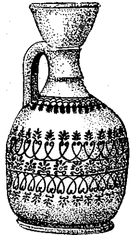
Рис. 1. Чернолаковый лекіф із штапованим орнаментом (1920/47, № 146).

Група II. Лекіфи цієї групи відрізняються від першої віnciaми, що мають форму дзвіночка, широким корпусом, стилем виконання роз-