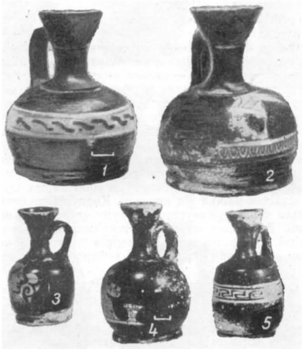
Таблиця III. Червонофігурні арибалічні лекіфи.

Варіантом цього типу є лекіф із комплексу 1901/66 64 . Він відрізняється від попередніх лише формою корпусу, а також манерою вико-