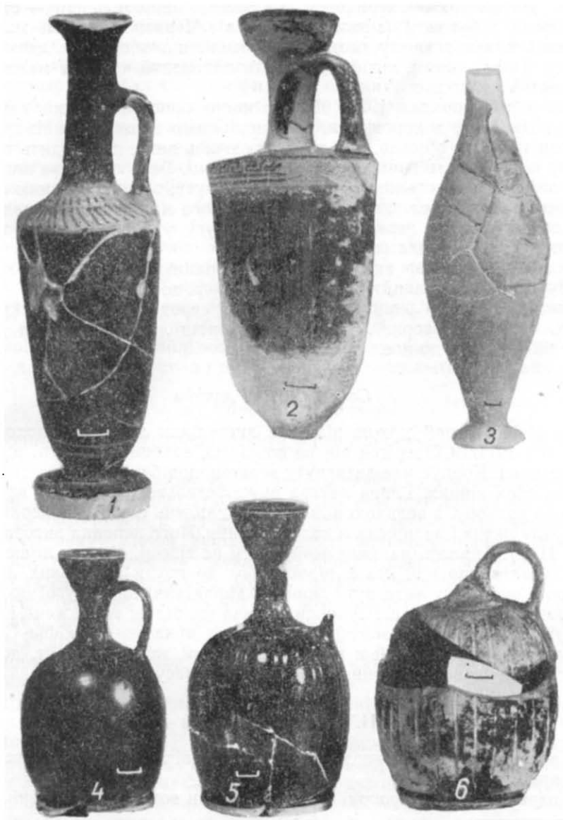
Таблиця II. Лекіфи V—IV ст. до н. е.

Червонофігурні лекіфи ольвійського некрополя V—IV ст. до н. е., дуже нечисленні. Вони представлені одиничними знахідками аттичної кераміки. Повністю збереглося всього два екземпляри.