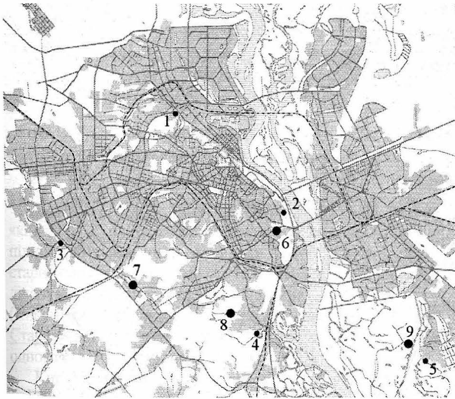
Рис. 1. Карта розташування археологічних пам'яток другої половини XIII – XIV ст. на території Києва (1 – Кирилівський монастир, 2 – Печерський монастир, 3 – Софійська Борщагівка, 4 – Китаїв, 5 – Бортничі, 6 – Звіринець, 7 – Жуляни, 8 – Голосіїв, 9 – Бортничі)

вторинне використання. В зачистці також виявлено уламок плаского листа міді розміром 9,5x8 см, що складається з двох зігнутих навпіл половинок.