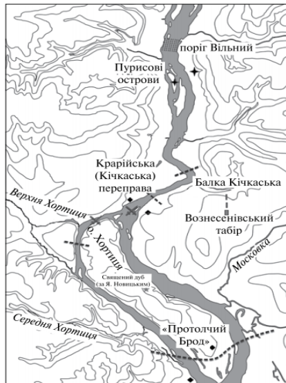
Рис. 5. Археологічні пам'ятки доби Київської Русі в південній частині дніпрових порогів (за М. Остапенком) . – М. Остапенко, Знахідка меча X ст. біля Хортиці (до питання про похід князя Святослава «в пороги» 972 р.) , «Археологія» 2016, № 3, с. 50.