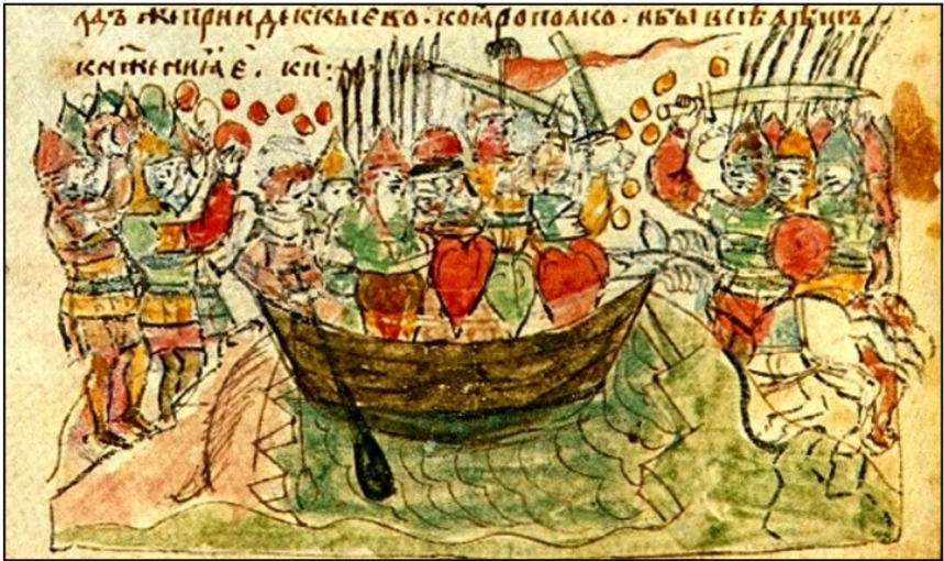
Рис. 4. Мініатюра сюжету вбивства Святослава з Радзивіллівського літопису. – А. Комар, Место гибели князя Святослава: поиски, легенды, гипотезы, мистификации , «Stratum plus. Археология и культурная антропология» 2014, с. 237.