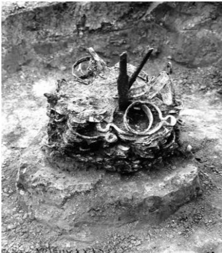
Рис. 1. Вознесенський скарб. Фото 1930 р. зі звіту В. Грінченка. – Г. Шаповалов, «...Прийшов Святослав у пороги...», «Княжа доба: історія і культура» 2014, Вип. 8, с. 107.