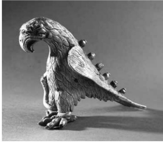
Рис. 2. Срібне навершя у вигляді орла з Вознесенського скарбу. Запорізький краєзнавчий музей. Фото 2012 р. – Г. Шаповалов, «...Прийшов Святослав у пороги...», «Княжа доба: історія і культура» 2014, Вип. 8, с. 107, 109.