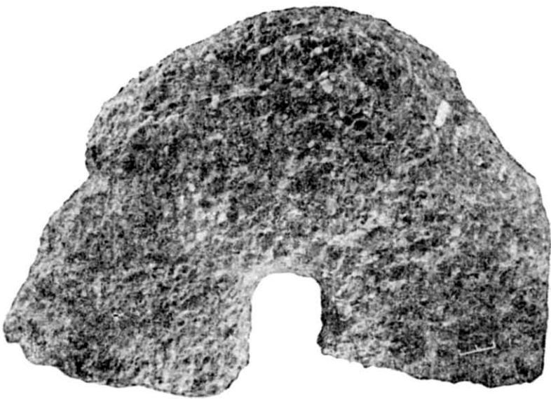
Рис. 3. Жорновий камінь з млинової споруди.

мочене ґрунтовими водами. Долівка вимощена дрібними камінцями і вимазана глиною товщиною 10 см. Глина випалена. Цей захід був застосований, очевидно, проти надміри вологості мешканцями житла. Подібні об'єкти зустрічаються у пшеворській культурі на території Польщі 23 .