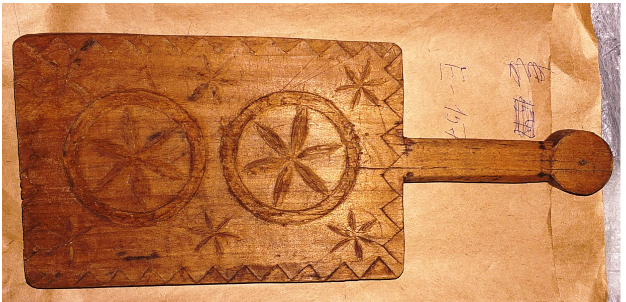
Рис. 7, 8, 9