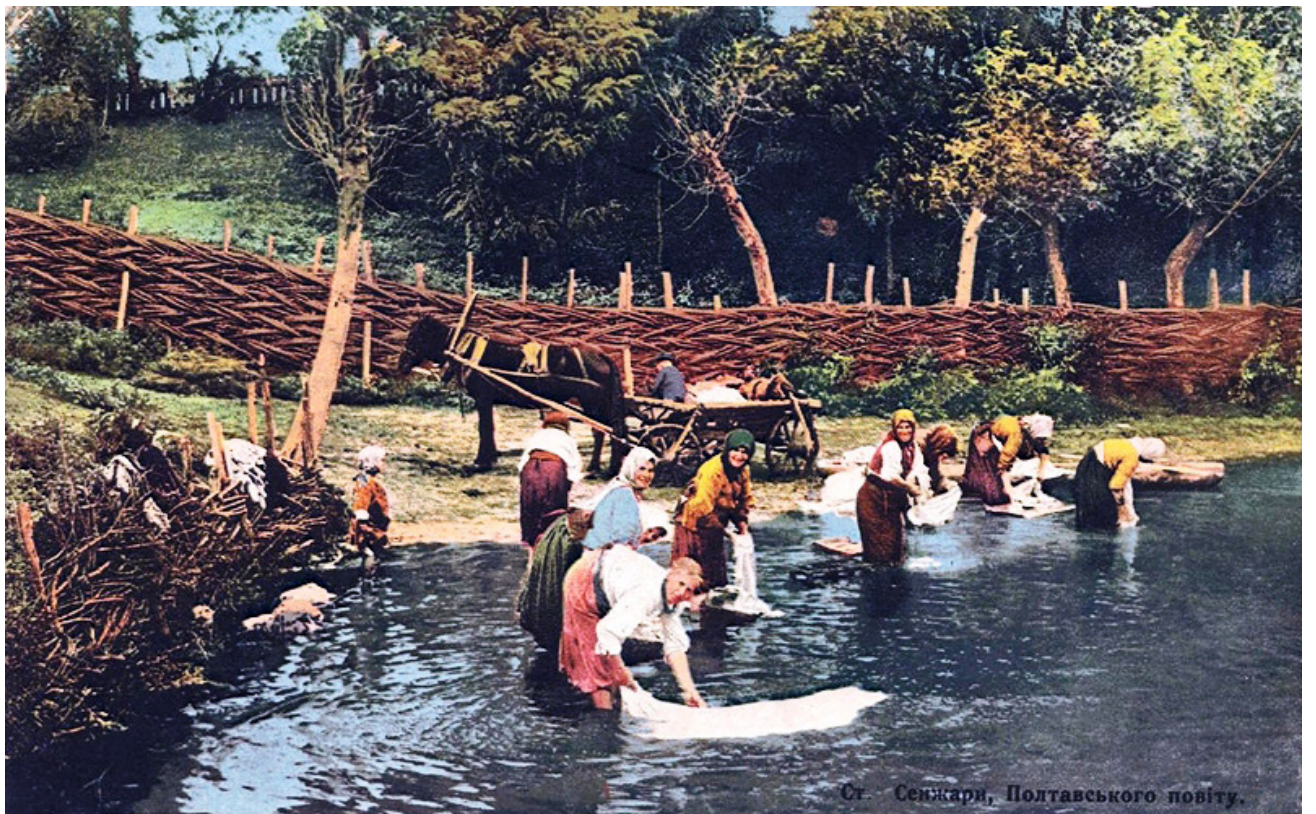
Ст. Сенжари, Полтавського повіту.