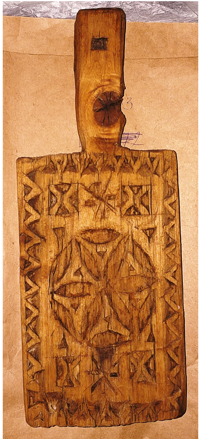
Рис. 5, 6