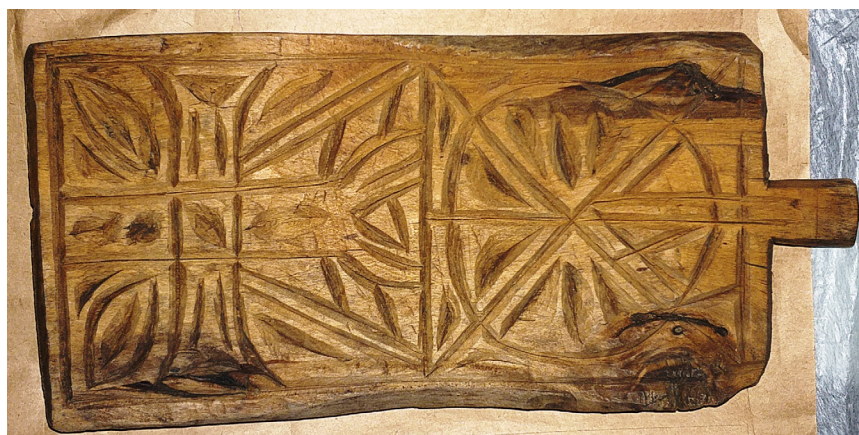
Рис. 1 - 4