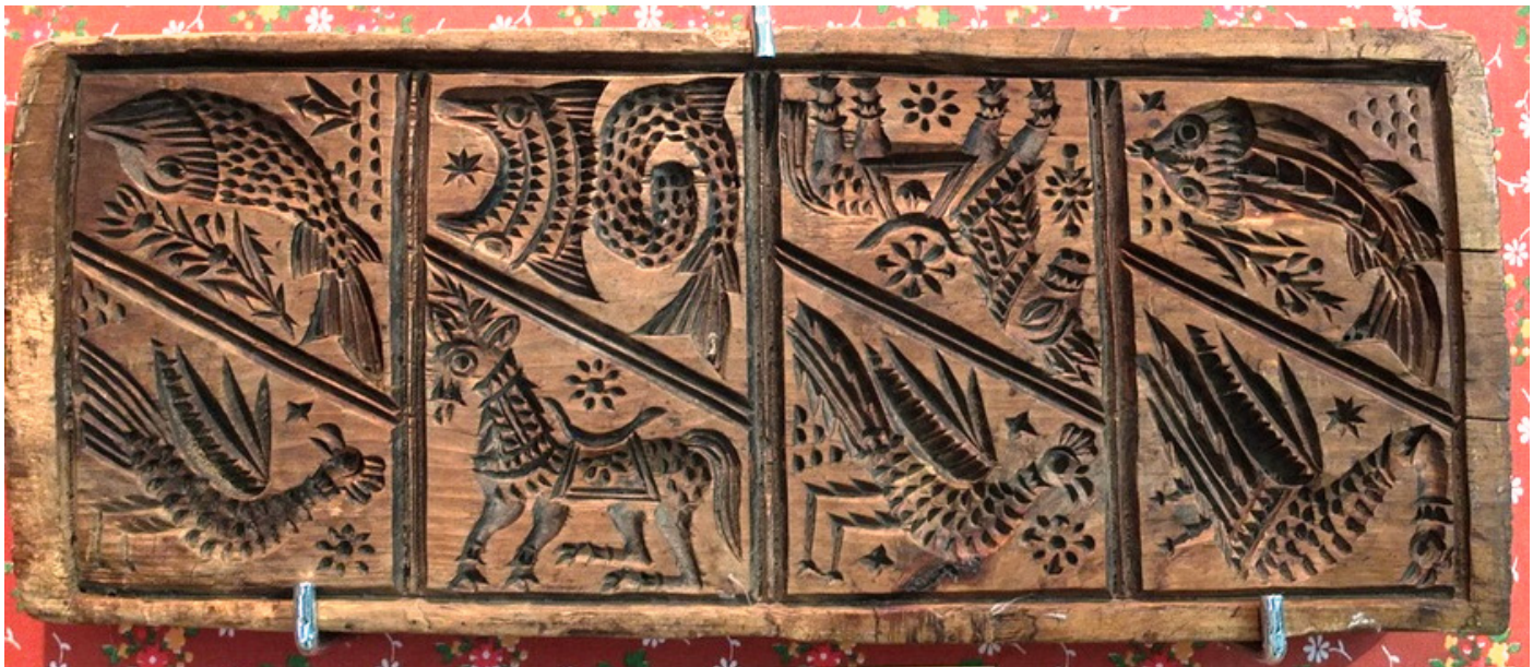
Рис. 14, 15, 16