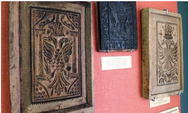
Рис. 10, 11, 12, 13