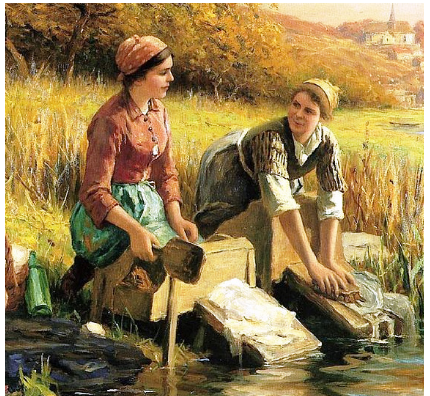
Рис. 20 - 22