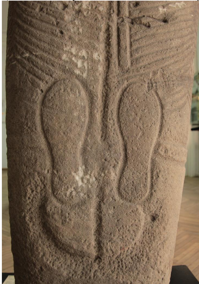
Рис. 4. Зворотній бік Федорівського ідола.