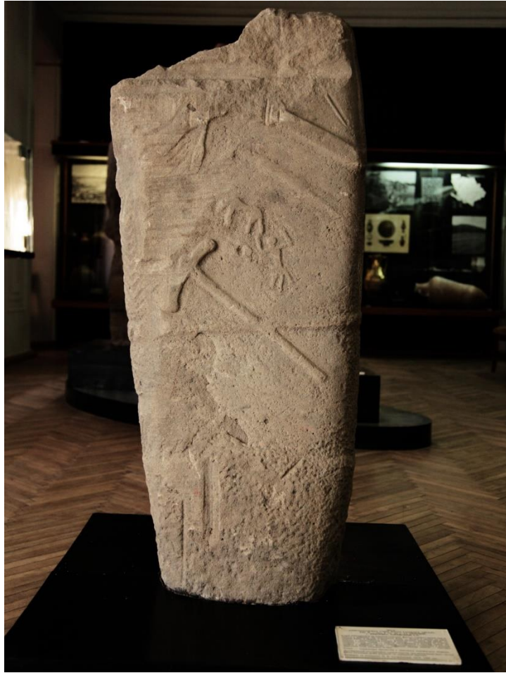
Рис. 3. Лицьовий бік Федорівського ідола.