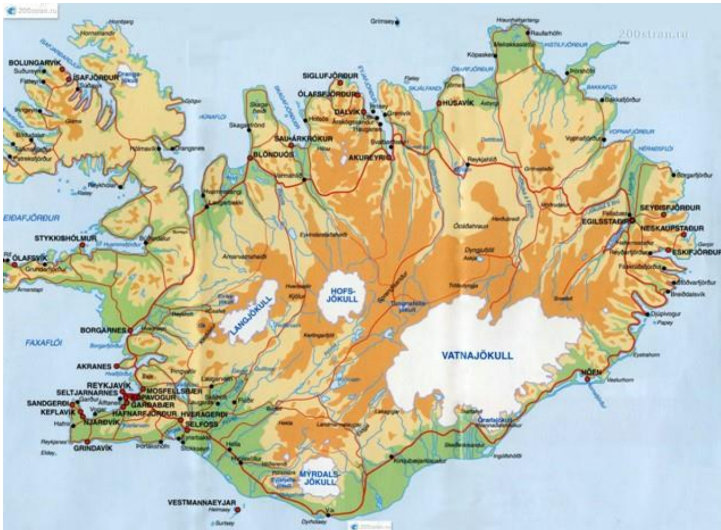
22. Електронний код доступу: de-nahoditsyawebmandry.com/podrobnaya-karta-islandii-g-islandiya-na-karte-mira/