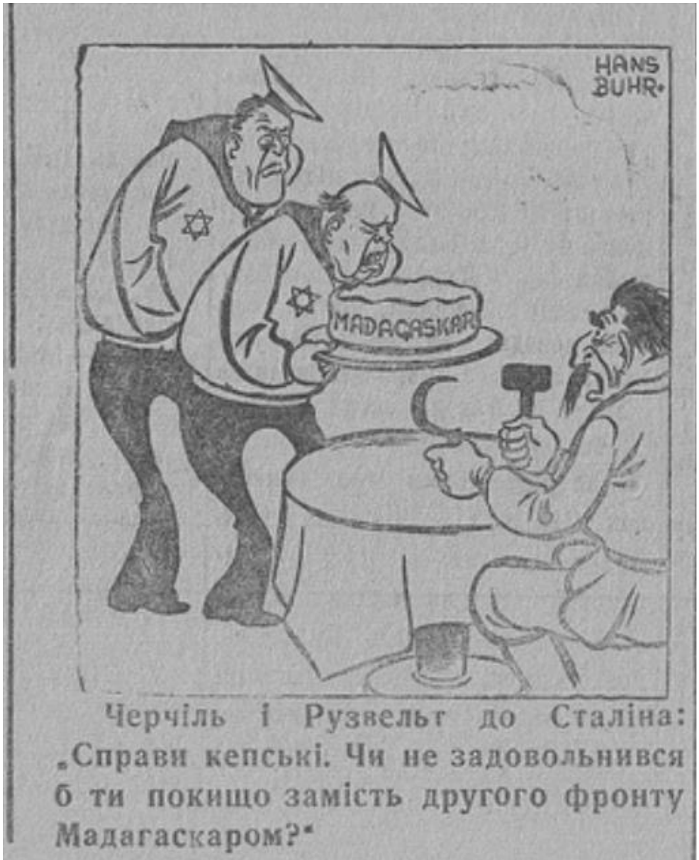
54. Відбудова (Костянтинівка). – 1942. – № 12 (82), 7 листопада.