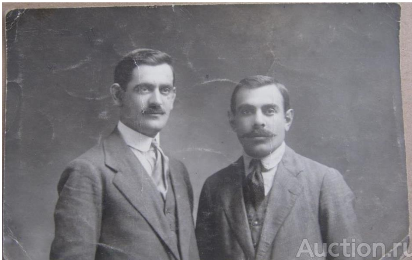
[6]. Фото двух мужчин.

Здесь много говорят о следующем «инциденте». Поверенный Б – ш и управляющий нотариальной конторы ...вицкого Л – кий – два закадычных друга сидели в зале 1-го класса при местной железнодорожной станции и воздавали дань Бахусу. Когда они дошли до состояния невменяемости, то Б – ш, обиженный пущенным по адресу его жены Л – ким словечком клеветнического свойства, поколотил последнего бутылкой по голове с такой силой, что бутылка разлетелась вдребезги. Б – ш, в свою очередь, и получил от Л. Сильный удар в лицо простой палкой, и пошла писать губерния... И весть, чем кончилась бы эта принимающая угрожающие размеры «дуэль» двух пьяных интеллигентов, если бы ей не положил конец подоспевший жандармский унтер-офицер, который составил протокол у случившемся [87].