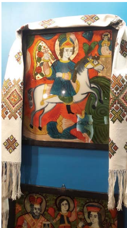
Традиційна українська ікона на склі «Святий Юрій». м. Лодзь, Археологічний і етнографічний музей