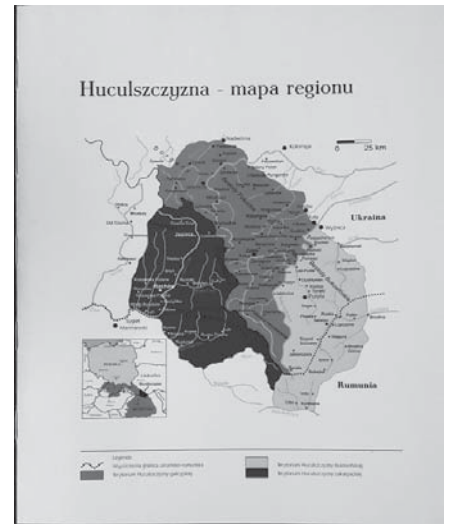
Районування Гуцульщини. Карта з книги Аліції Возняк «Вирізнени строєм» (Лодзь, 2012. С. 5)