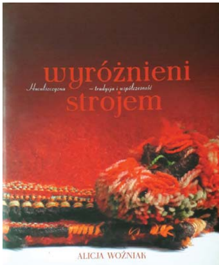
Обкладинка книги: Woźniak Alicja. Wyróżnieni strojem. Huculszczyzna – tradycja i współczesność . Łódź : Muzeum Archeologiczne i Etnograficzne w Łodzi, 2012