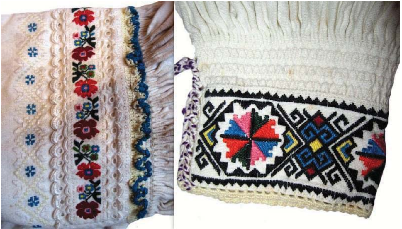
Рис. 5. Оздоблення вишивкою, морщенням і воланами верхньої плечової частини рукава та манжет жіночих «волоських» сорочок великобичківських гуцулок.