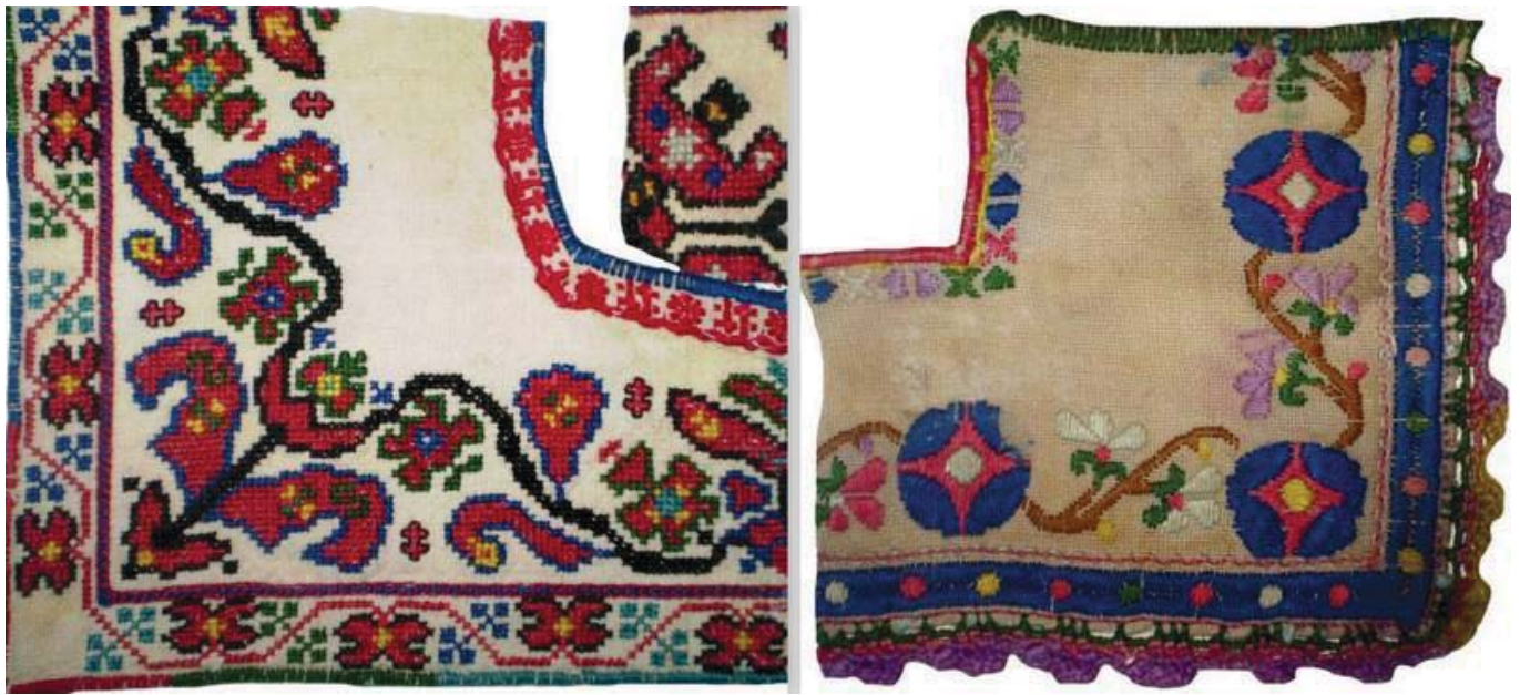
Рис. 7. Оздоблення вишивкою жіночих «волоських» сорочок королівських долинян.