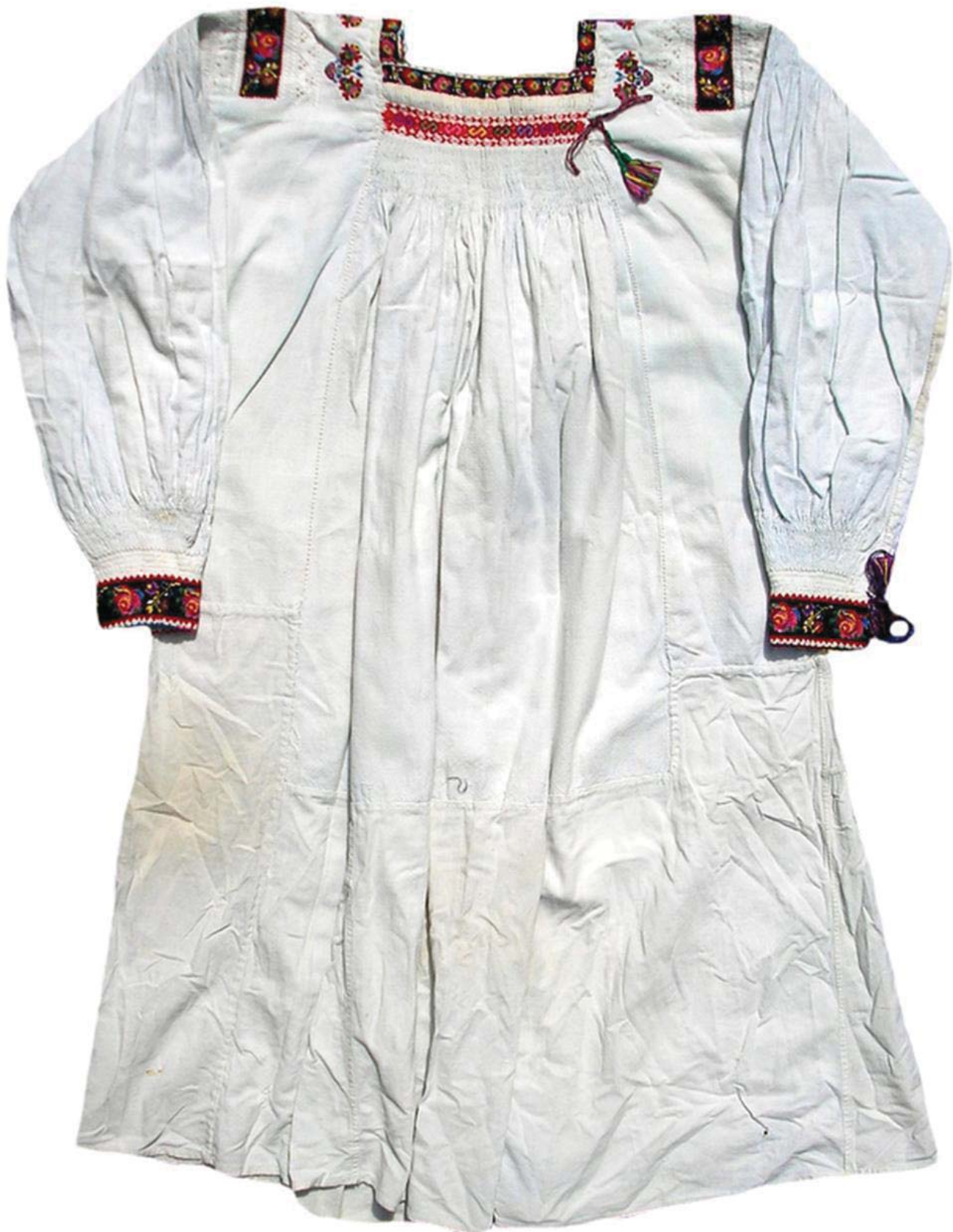
Рис. 2. Жіноча сорочка, с. Дубове Тячівського району. Домоткане полотно, вишивка. 20-40-ві рр. ХХ ст.