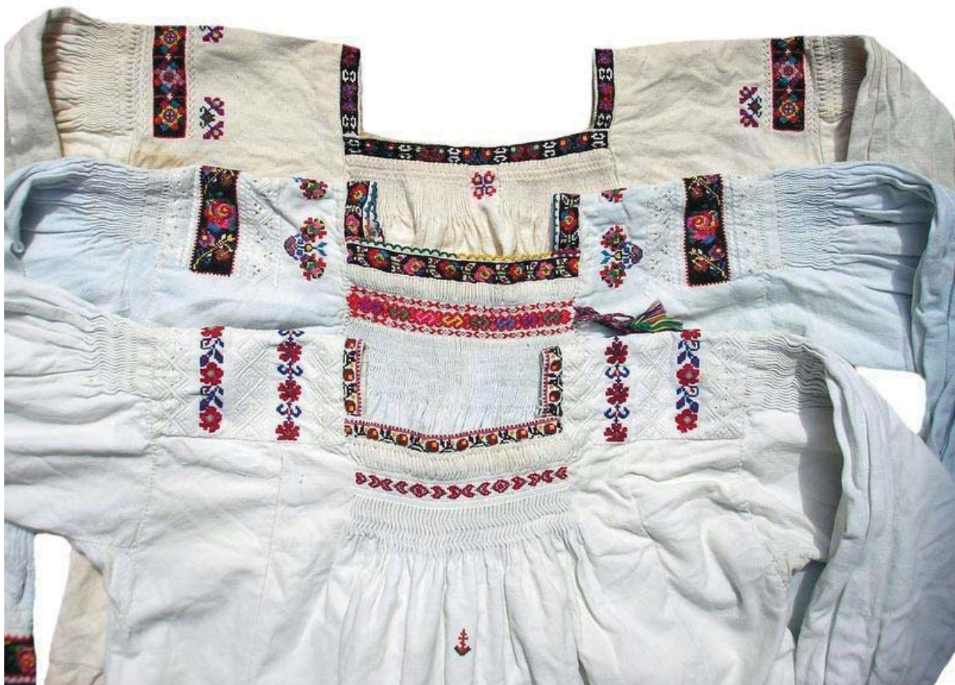
Рис. 3. Оздоблення вишивкою прямокутного вирізу горловини жіночих «волоських» сорочок тересвянських долинянок.