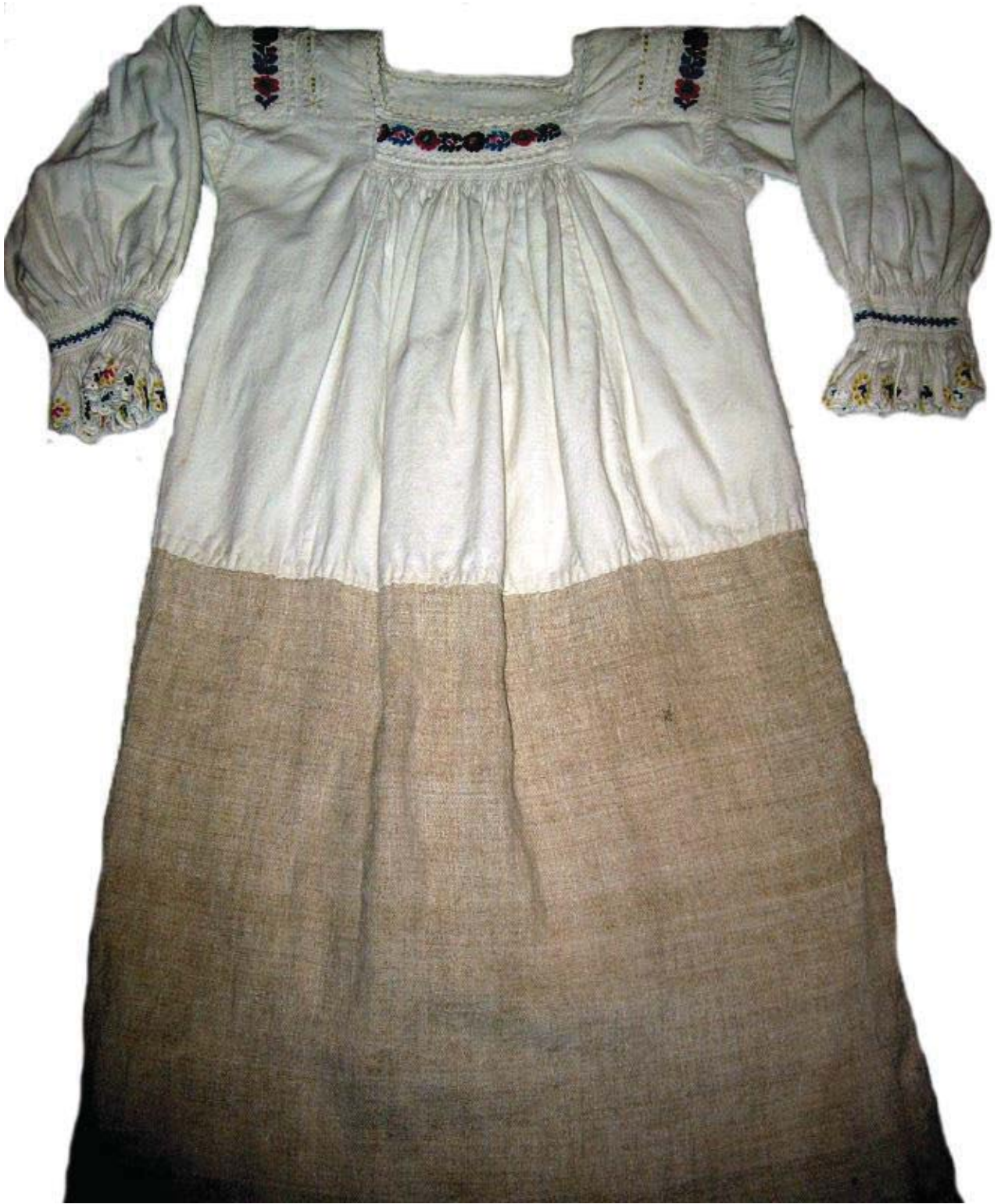
Рис. 4. Жіноча сорочка, с. Верхне Водяне Рахівського району. Домоткане полотно, вишивка. 20-40-ві рр. XX ст.