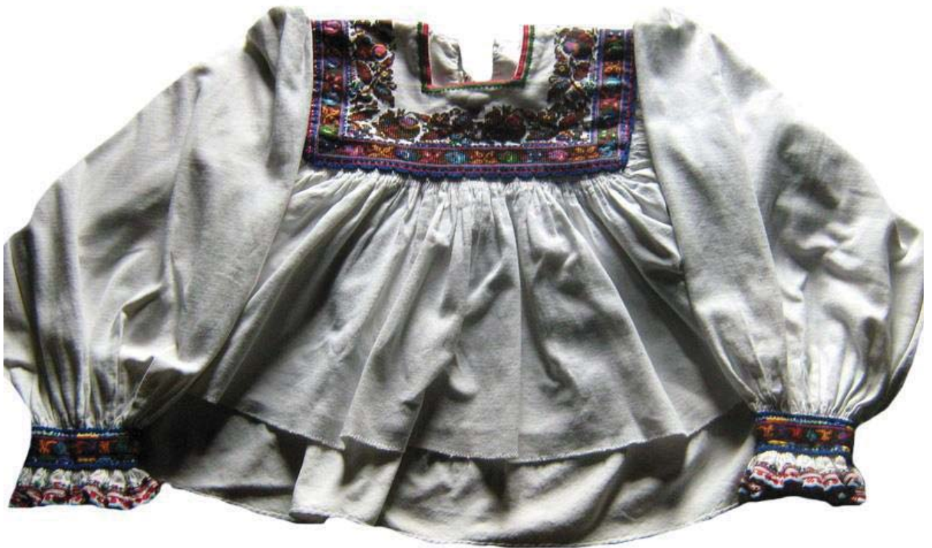
Рис. 6. Жіноча сорочка, с. Хижа Виноградівського району. Домоткане полотно, вишивка. 20-40-ві рр. ХХ ст.