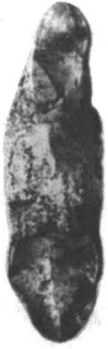
Рис. 4. Гривна з Готландського скарбу.