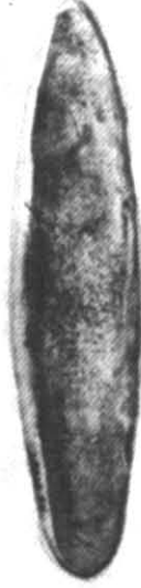
Рис. 5. Гривна з Готландського скарбу.