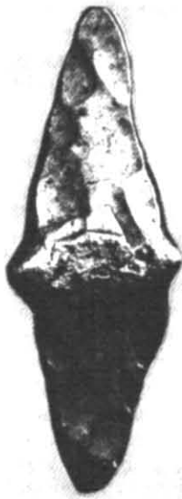
Рис. 6. Гривна з колекції Ермітажу.

поспіхом. Слід гадати, що особливо недовірливі контрагенти прямо на ринку бажали упевнитися в якості срібла, вдаряючи по гривні обухом бойової сокири чи руків'ям ножа. Саме так виглядають сліди вторинних ударів на багатьох гривнях (рис. 6).